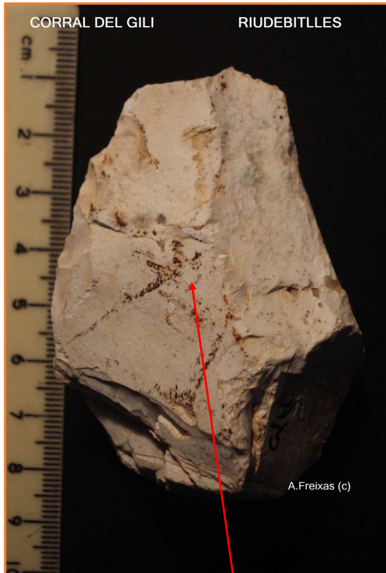
Cara B Senyal de rella.