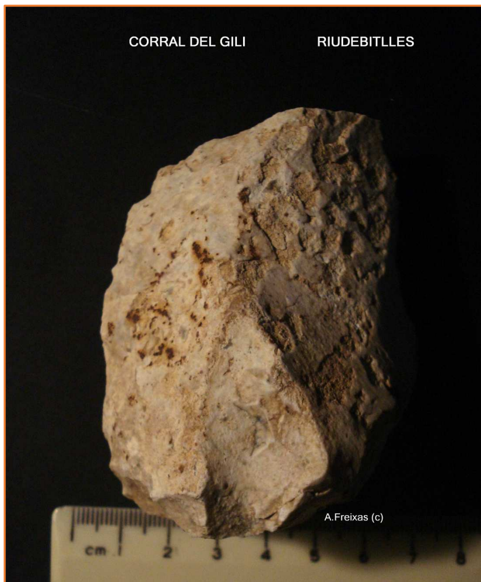
Nucli, amb la extracció de una Punta.