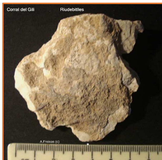
Cara B amb concrecions.