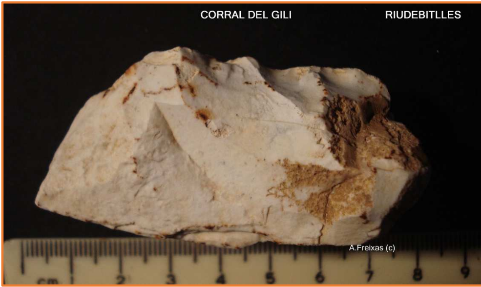
Denticulat/Resta de Nucli .?