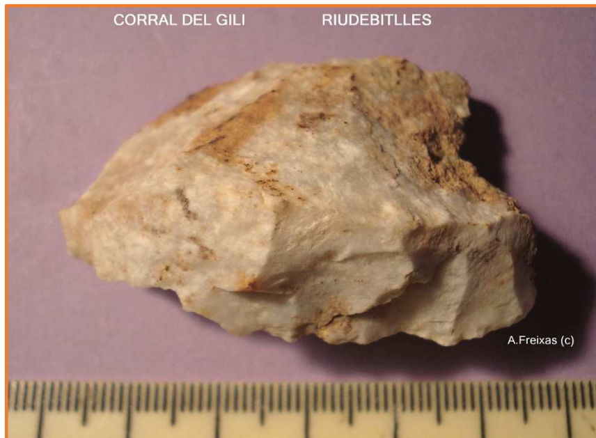
Vora de Nucli amb les extraccions marcades al volt.