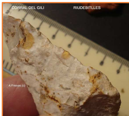
Detall de l'aresta i el retoc.