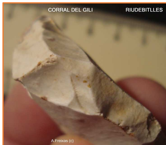
Detall de les empremtes.