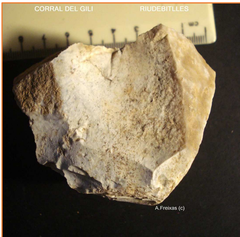
NUCLI DE SÍLEX AMB LA EXTRACCIÓ DE UNA ASCLA.

Materials significatius i localització de l'assentament.