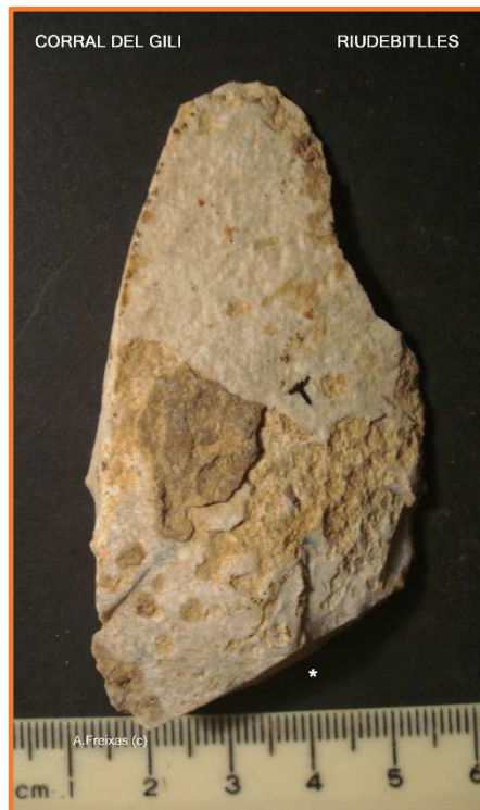
Cara B amb crosta calcària.