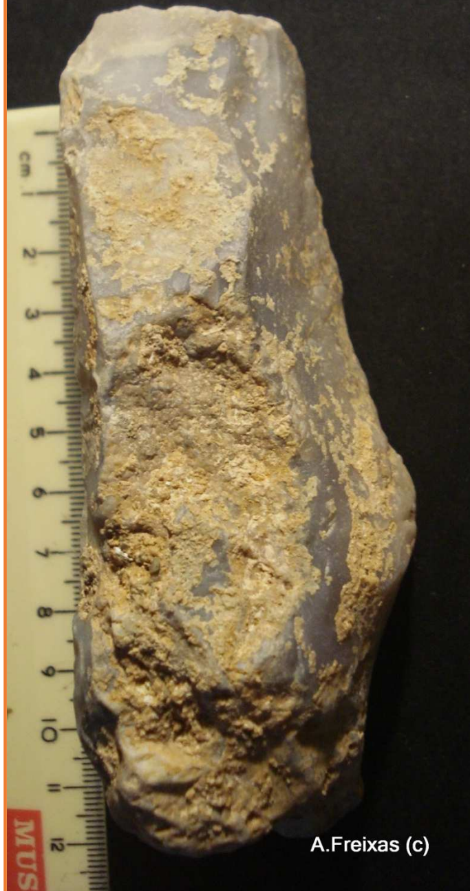
Nòdul de sílex gris de gra fi.