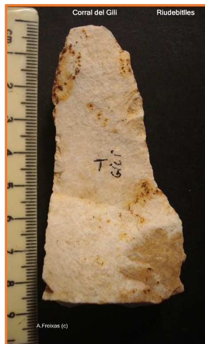
Resta de Nucli de làmines.