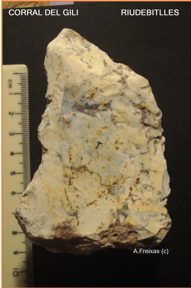
Cara B amb un cop a la zona distal.