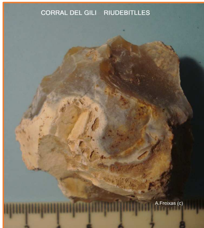
NUCLI AMB DUES PÀTINES.