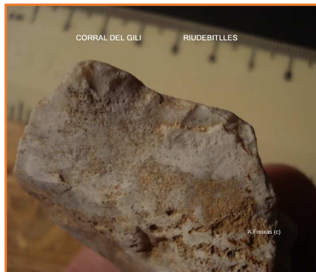
Detall del retoc.