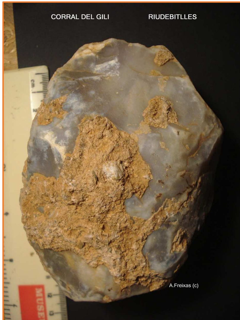
Ronyó/Nòdul amb cops unificials a la part distal.