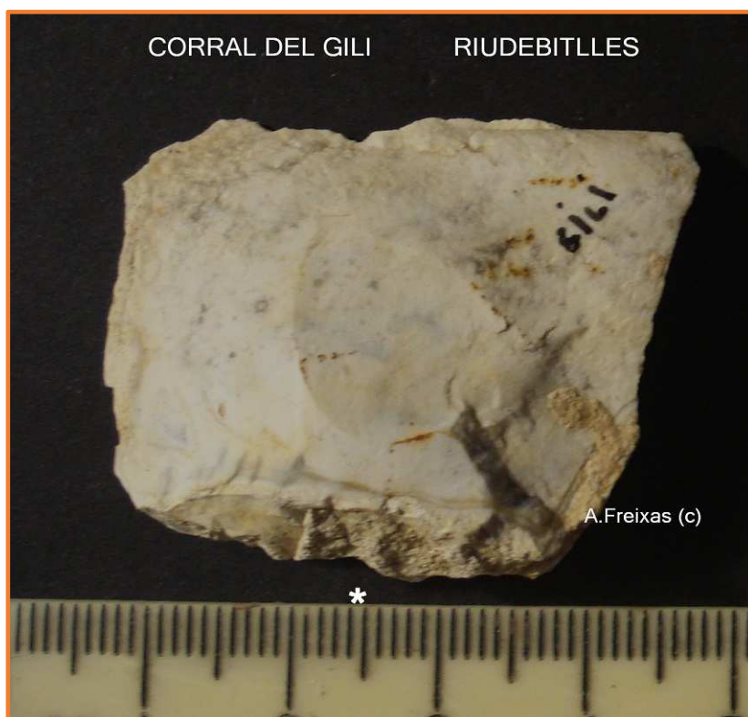
Pla de percussió. Extracció del bulb per aprimar.