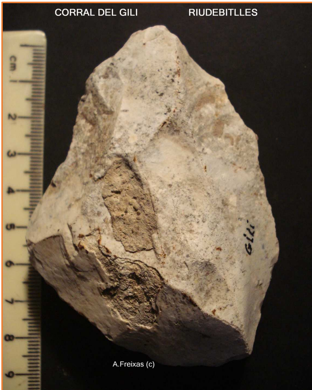
Cara B del Bifaç amb extraccions al volt.