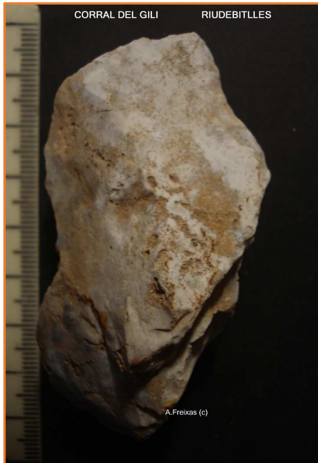
Rascadora còncava sobre ronyó.