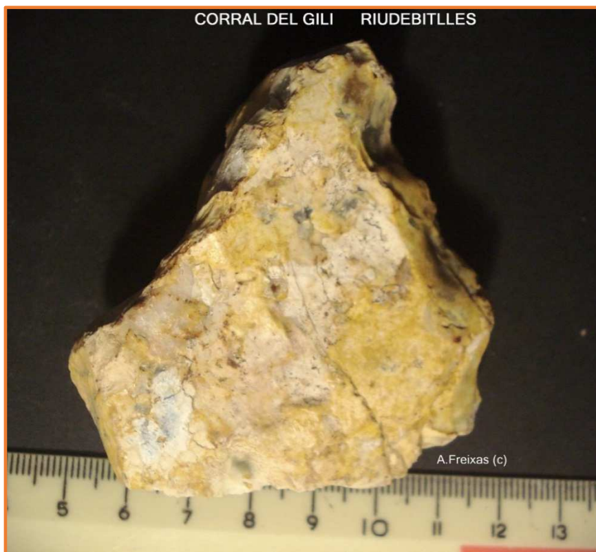
SÍLEX AMB PÀTINA GROGA.