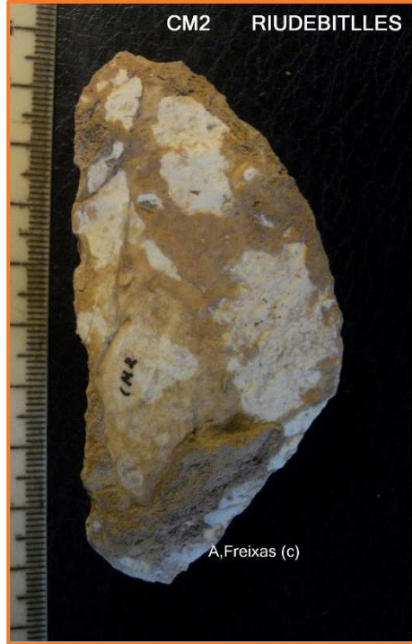
Ganivet amb dors natural damunt de ascla laminar