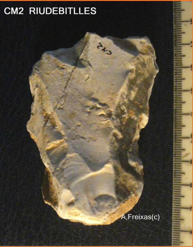
FENEDOR DAMUNT DE ASCLA AMB SENYAL DE RODAT I CONCRECIONS A LA CARA B