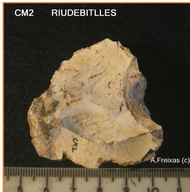
Nucli esgotat amb extraccions perifèriques