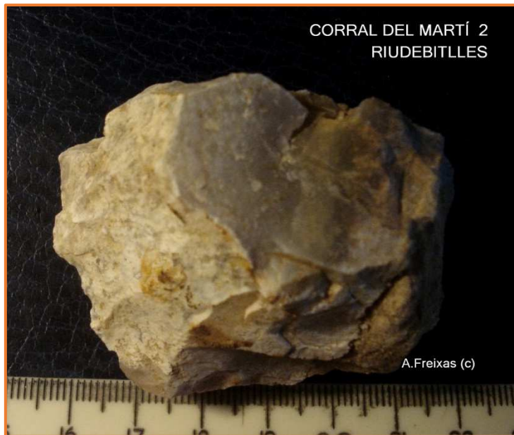
Reste de Nucli piramidal com a Denticulat ?.Neolí

CM2-B: El gruix més important de materials correspon als de la fase 2, amb pàtines, arestes vives i concrecions del substrat. Cal destacar el Nucli de talla recurrent Levallois?, el Fenedor sobre ascla laminar rodat i amb extraccions distals de la fase 1?, ascles amb un taló ben definit i amb angles superiors als 90º, el ganivet amb dors natural molt alterat i amb concrecions que fan difícil un anàlisi més acurat i finalment el Nucli Piramidal amb pàtina lleugera símil del Neolítics o post-holocens.