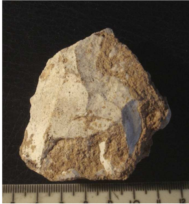
Reste de Nucli