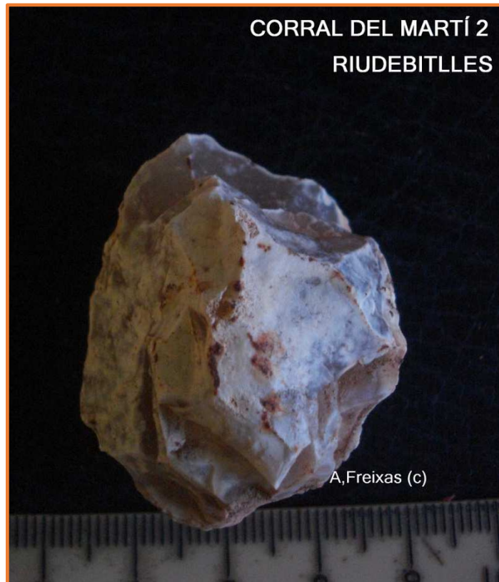
Nucli Polièdric *-Post-holocè-Neolític

CM2-F : Lot de peces del Corral del Martí 2 amb una representació de asclats , una Rascadora gruixuda damunt de ascla i una Punta Levallois desviada del substrat. Una Punta* de sageta del període Neolític/Eneolític, una ascla amb retoc per a manegar i un Nucli Polièdric del mateix.