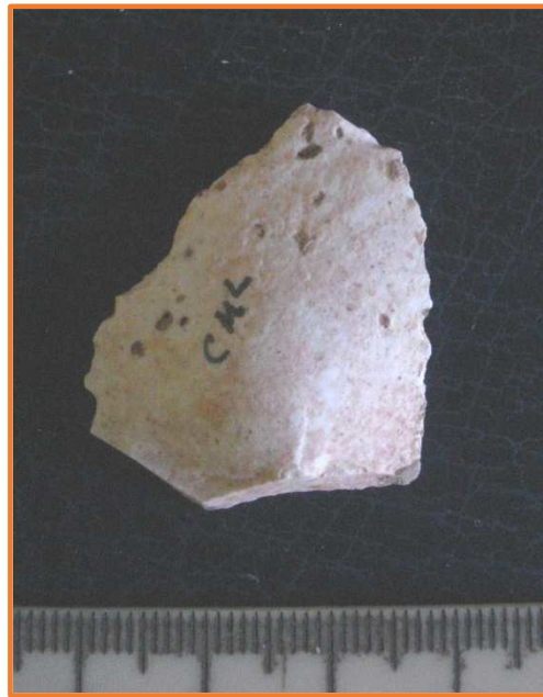
PUNTA LEVALLOIS DESVIADA