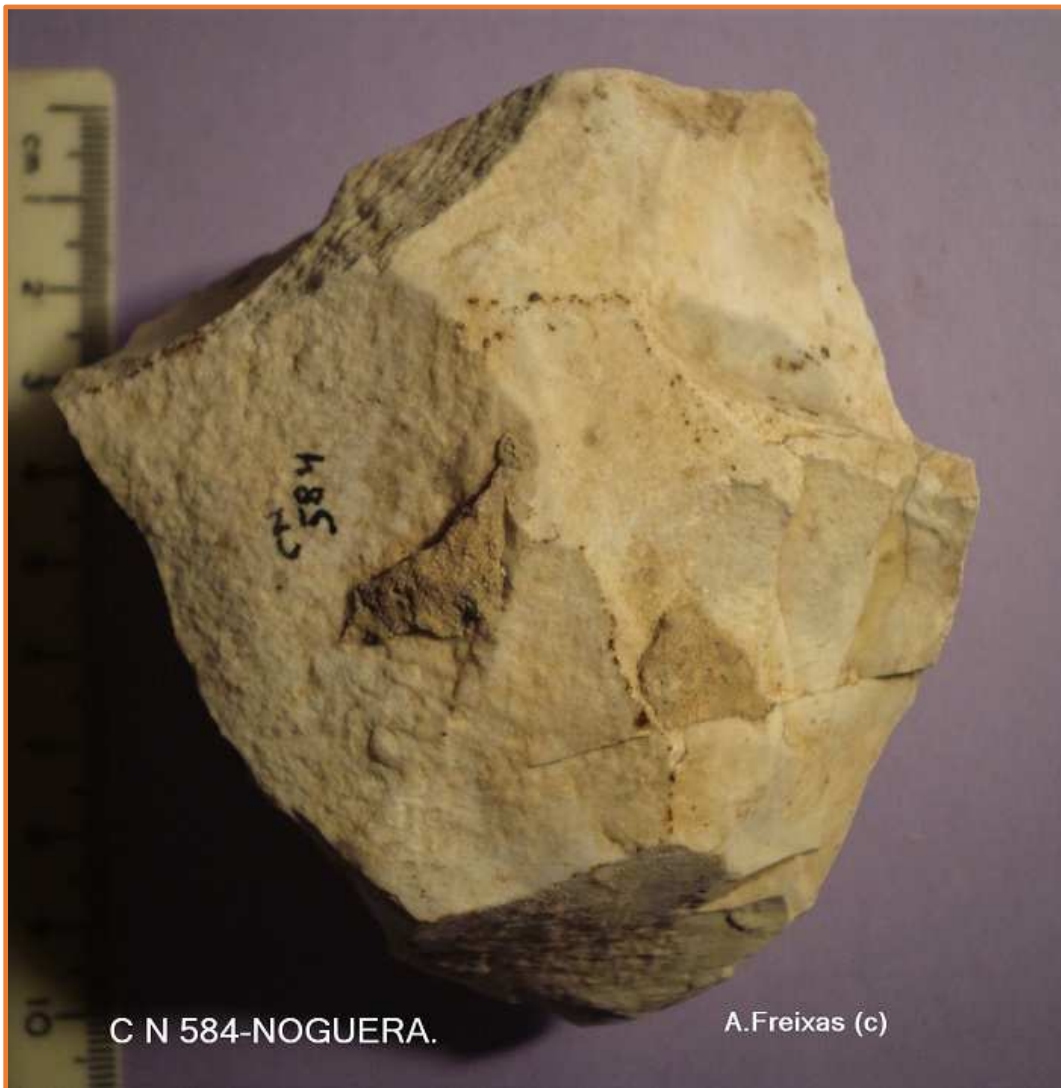
Nucli amb extraccions irregulars.