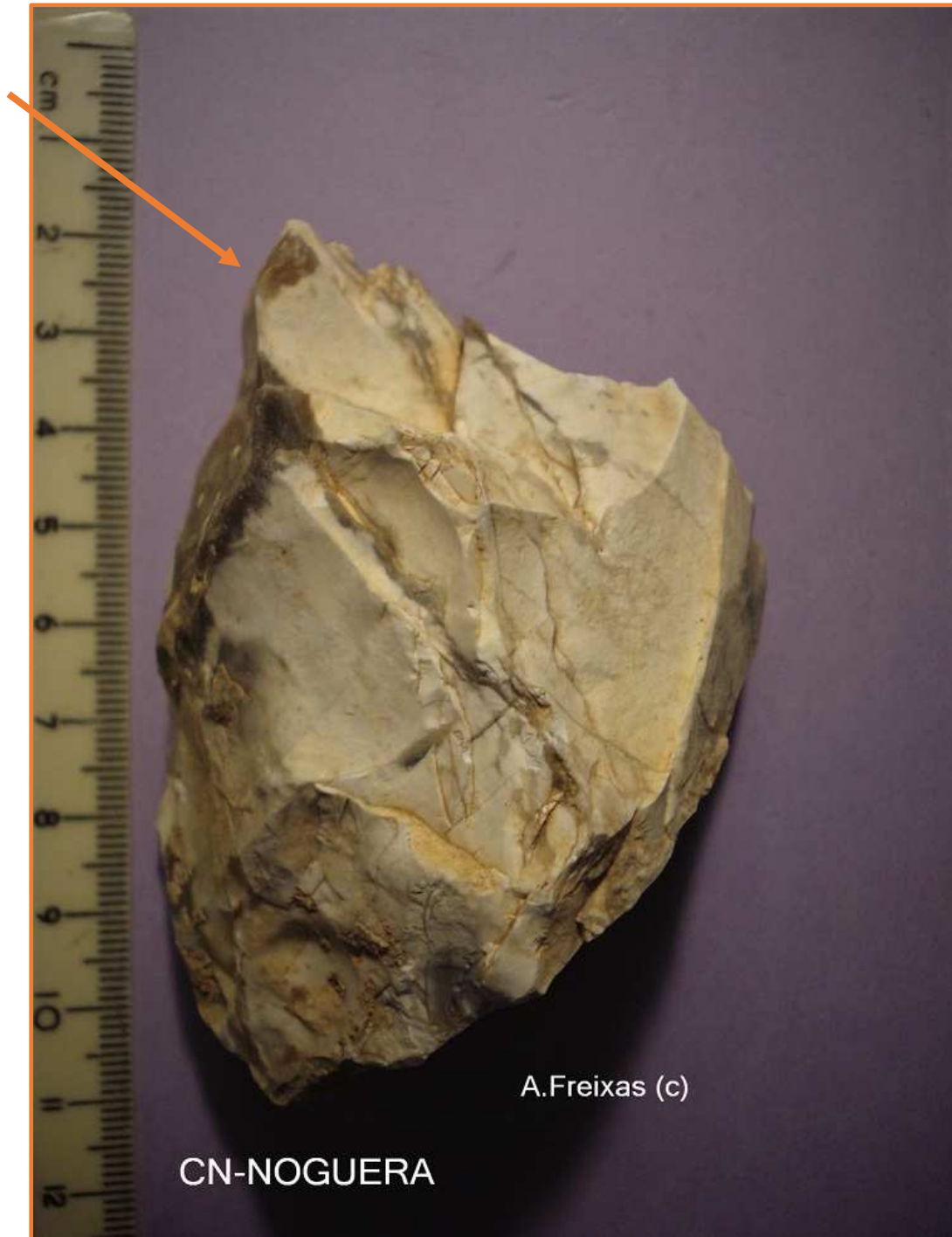
Xoper sobre sílex, amb extraccions distals.