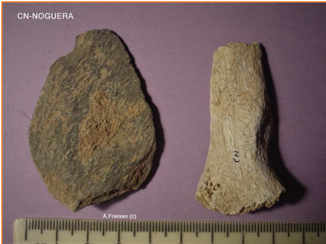
Palet de pissarra i os recent ?.

A la denominació de CN i correspon tot el material localitzat en superfície per damunt del con de dejecció de nom CN Strat. Son els relictos que s'han documentat com afins als localitzats en estratigrafia dins del con, i van formar part del treball publicat a la revista Cypsela.