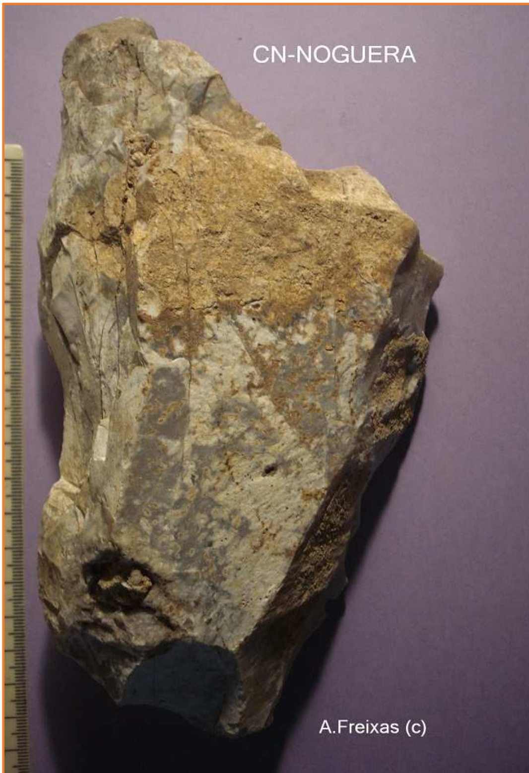
FENEDOR, amb estigmes de rodat i concrecions.