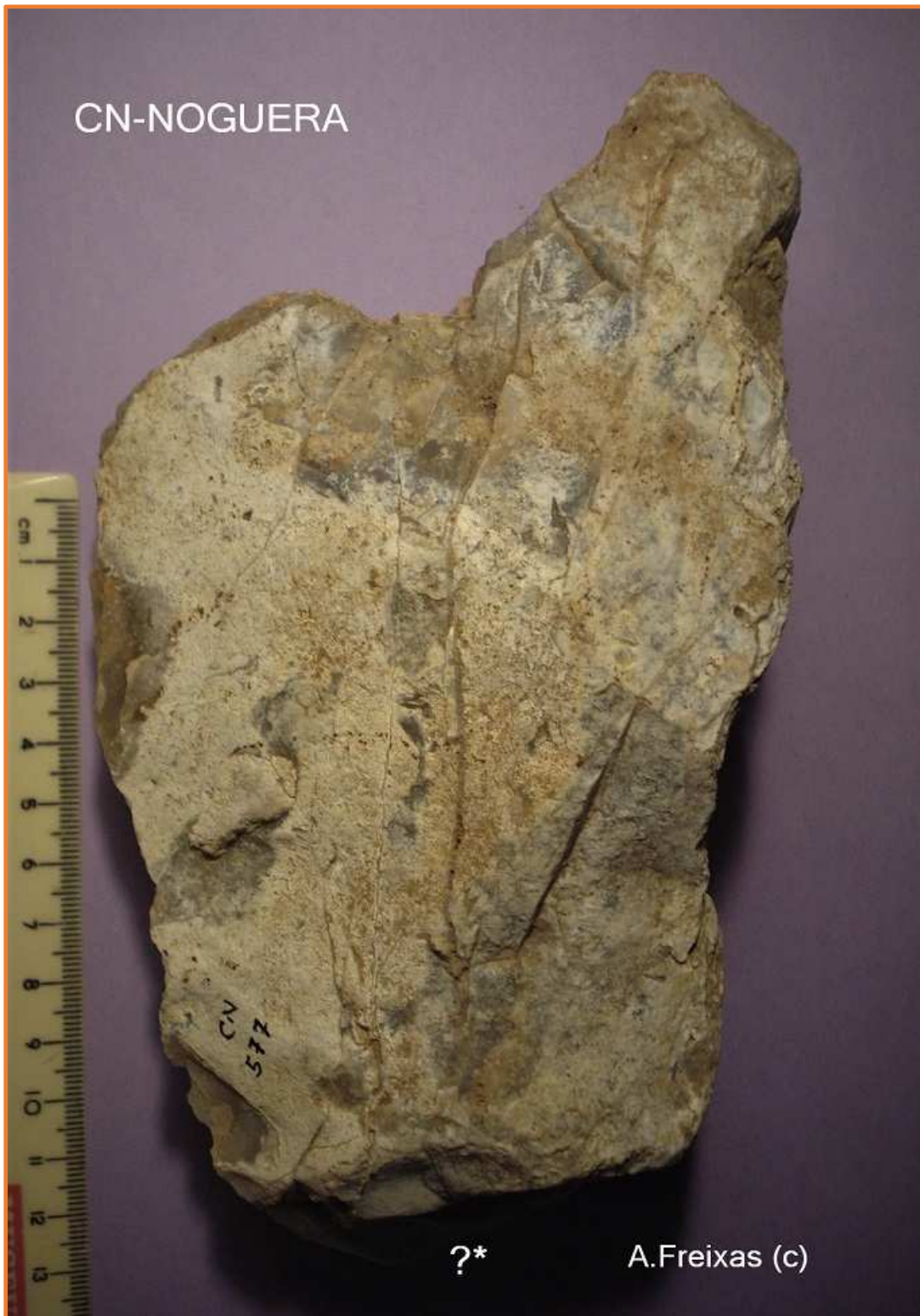
Cara B , amb possible pla de percussió treballat i extraccions laterals.