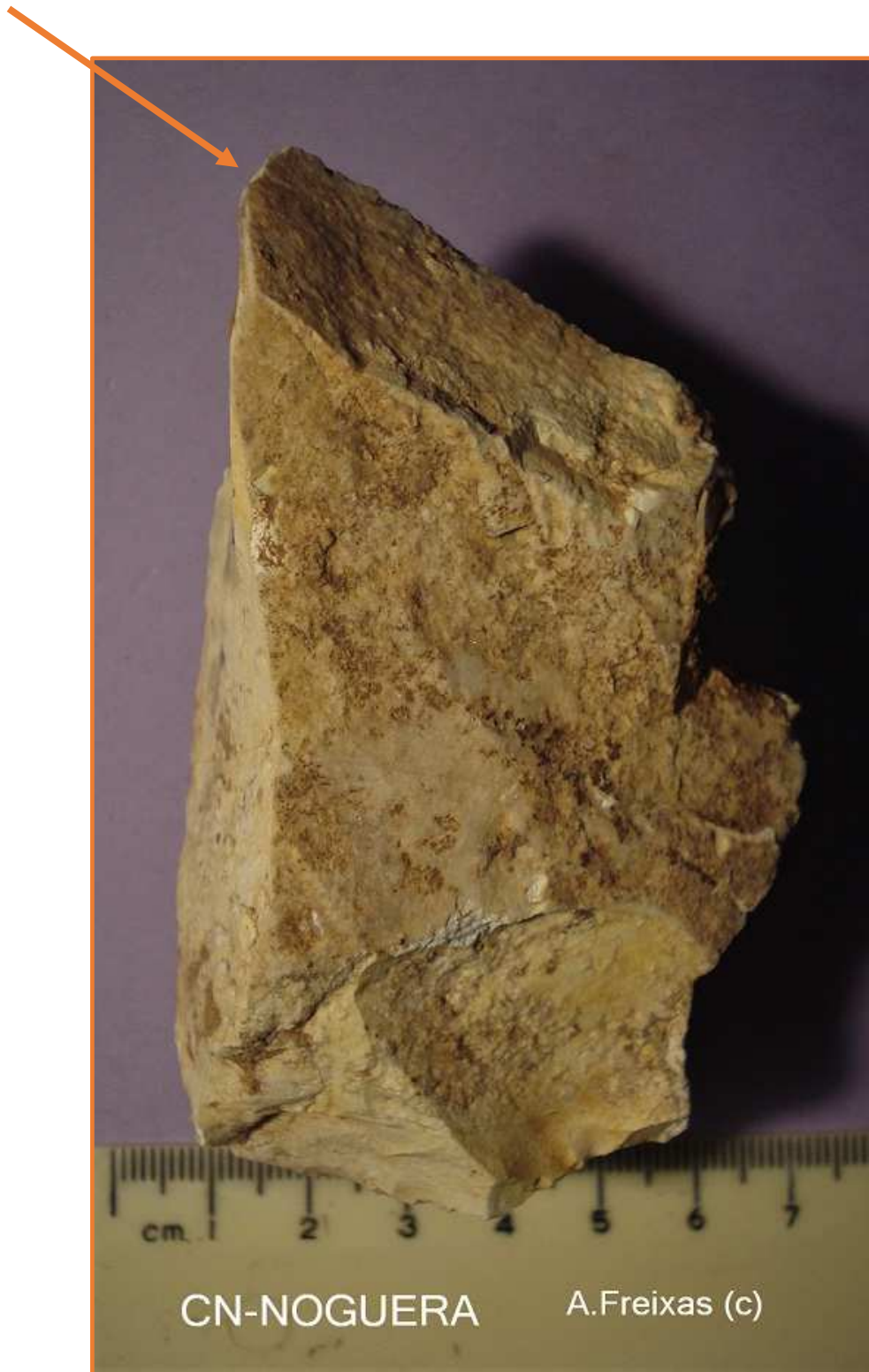
Sílex ,amb cop de Burí distal ?.