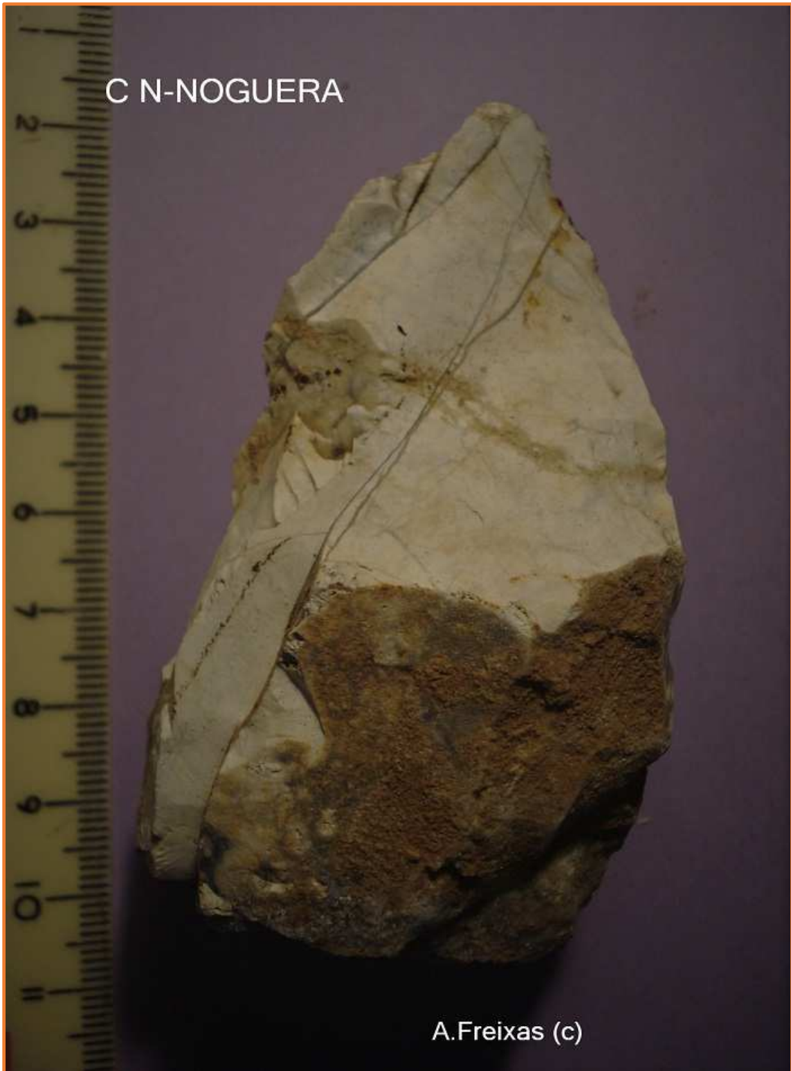
Pic sobre nòdul de sílex.