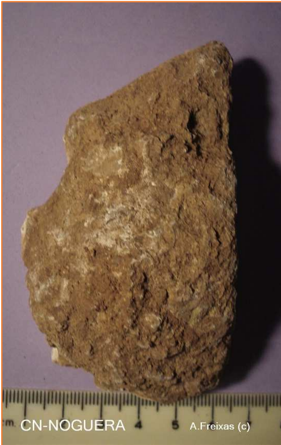
CARA B, amb crostes i concrecions del sol vermell.