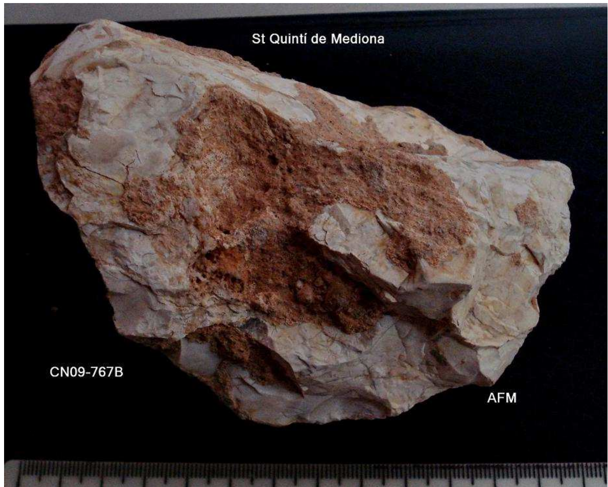
767 – Nucli Protolevallois de 12 x 7x 5'5 cm irreg ,concrecions. For V