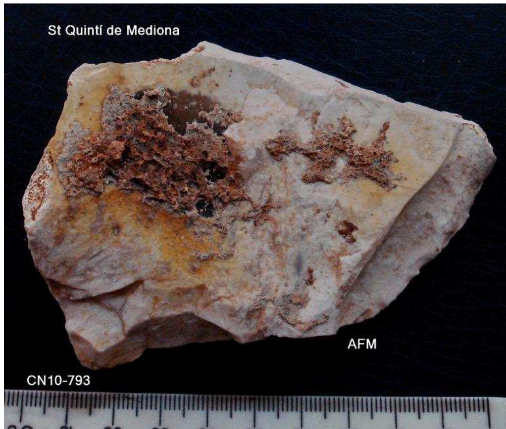
Antoni Freixas Massana © 2.014