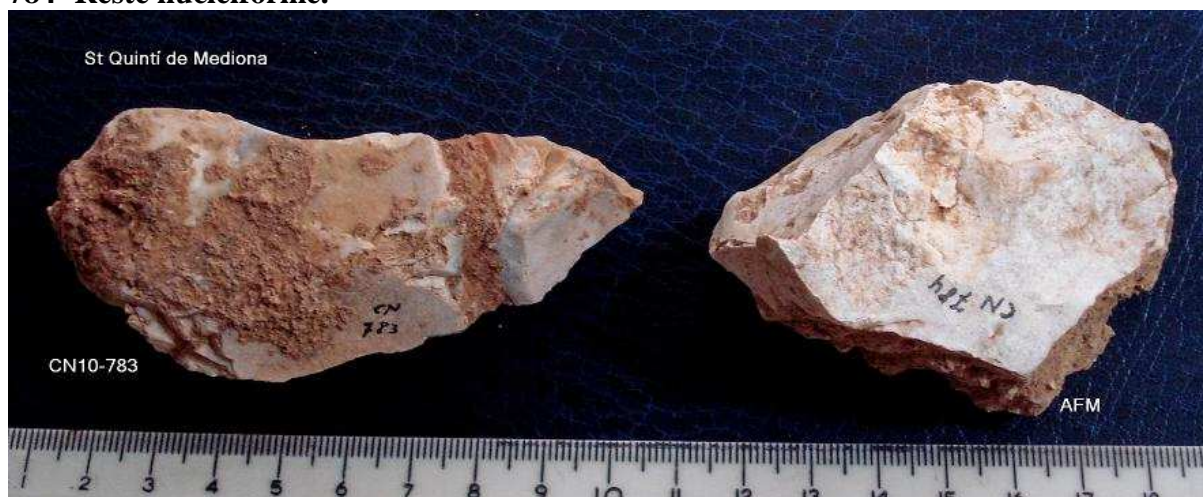
784- Reste nucleïforme.