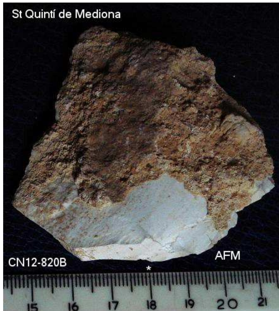
820- Ascla de 5'5x 5 cm , taló llis pla obert., pàtina –bulb bb –concrecions.