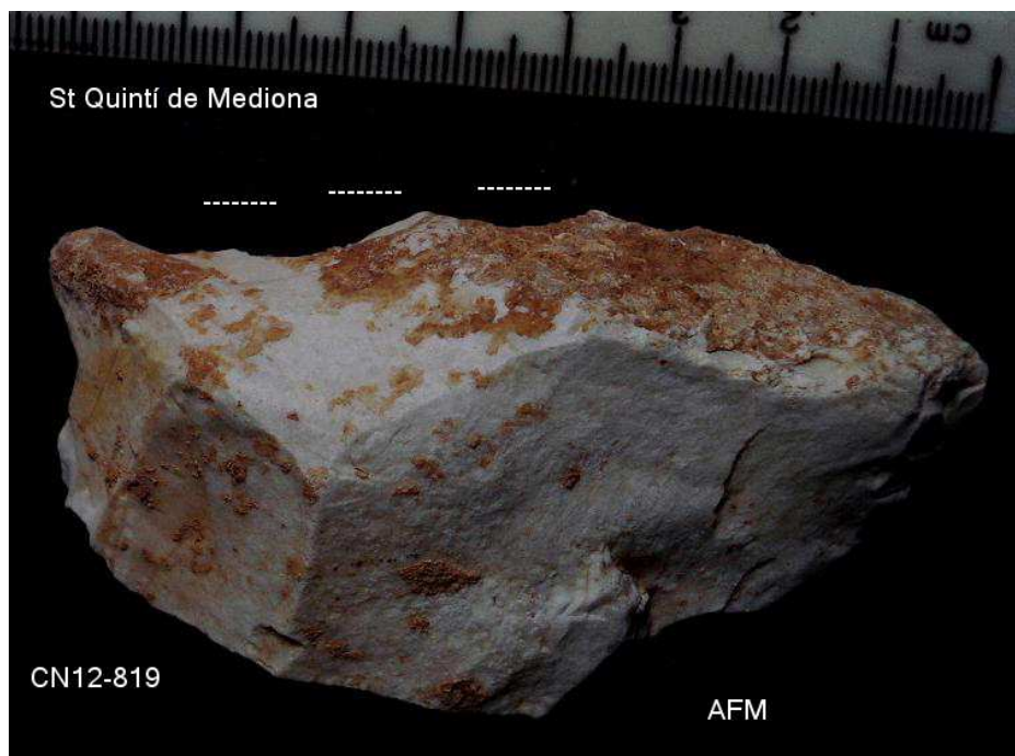
819- D21 Espina damunt nòdul sílex 8 x 3'5x 2'5cm + ret R.pro.d -pàtina blanc grog i concrecions llims vermells.