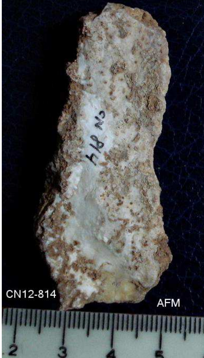
814- Lamineta cortical- de 6x 2 cm – alteracions i concrecions.