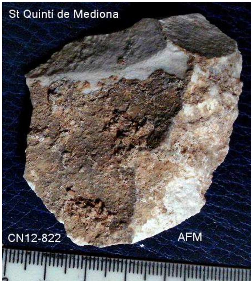
822- Ascla de 4'5x 5 cm – extraccions radials, taló llis pla – angle obert, pàtina i concrecions.