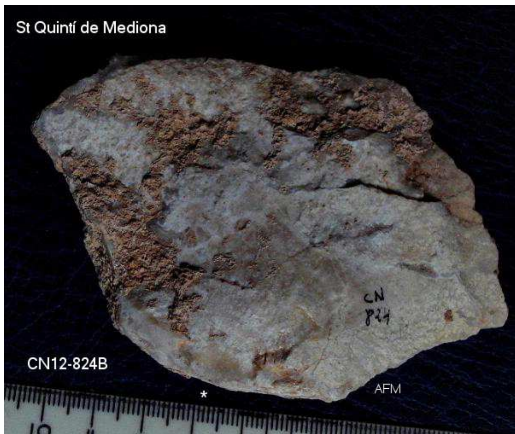
824- Ascla gran de 6x 10 cm (apaissada). concrecions còrtex , bulb bb.