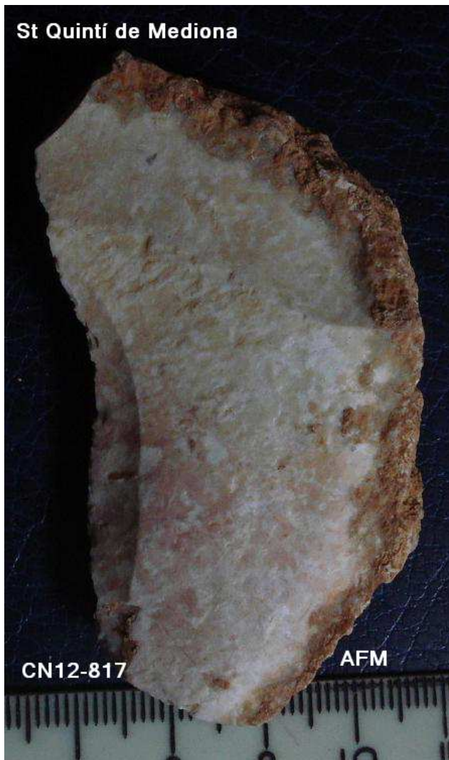
817- GANIVET DORS NATURAL . 6'5 X 3'5 cm -cortex lateral -taló llis pla obert Possible retoc util.