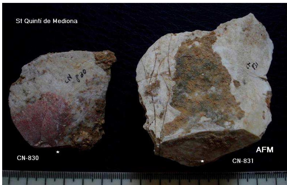
830 Ascla de 5 x 4 cm sílex rosat nuclear- taló facetat. Concrecions i pàtina- 831 Ascla gruixuda de 5 x 5 x 3'5 cm – taló llis pla obert, pat i concrecions verdoses.