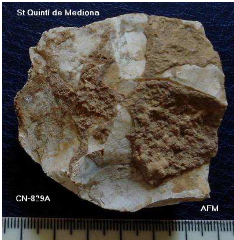
829 NUCLI DISCOIDAL de 6cm , extraccions radials, perifériques- 3 cm gruix, pat i concrecions.