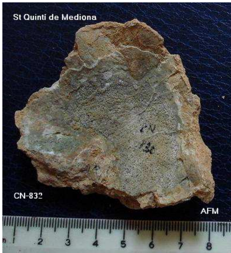
832 Calota calcària, embolcall de sílex.