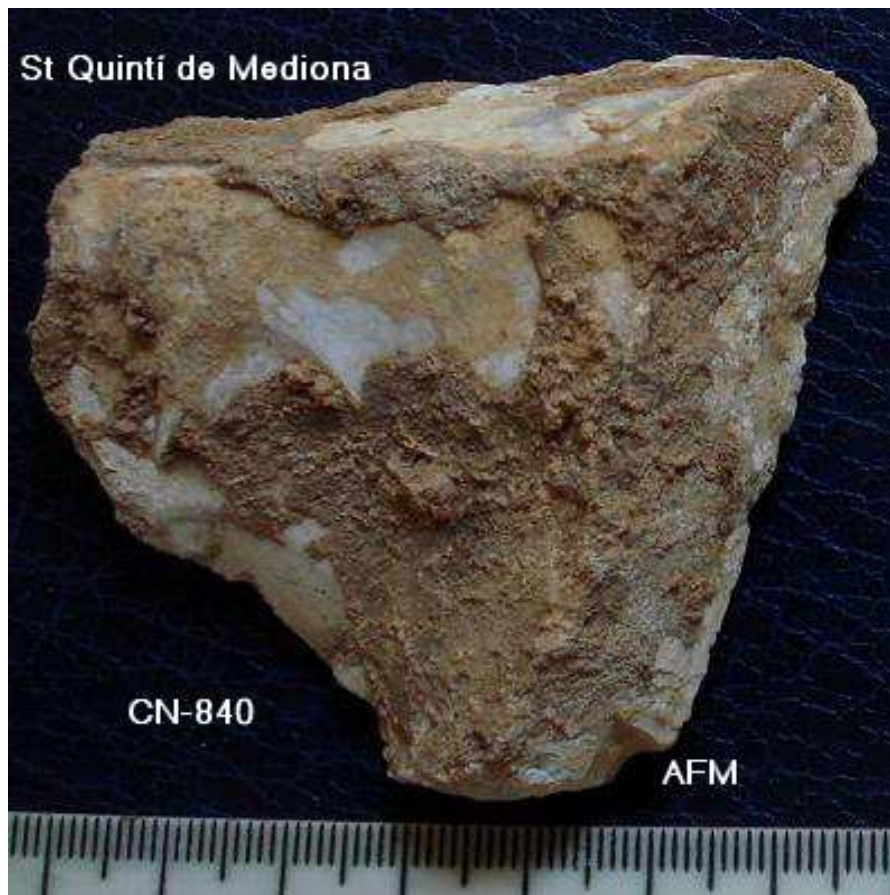
840 Ascla de planta triangular /Tepic, 6 x 6'5 cm – taló llis pla obert. possibil retc utilit.