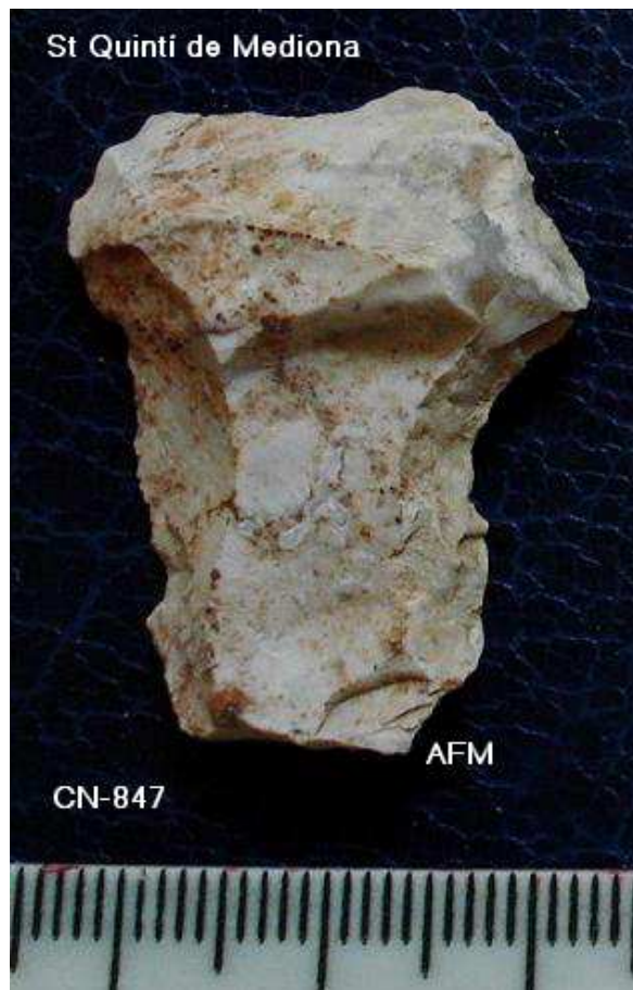
847 Lamineta de 4 x 2 cm taló llis , pàtina.