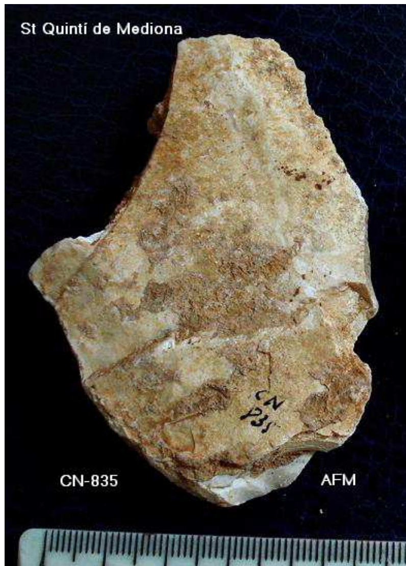
835 Ascla laminar de 7 x 4'5 cm , taló rebaixat. Alteracions i concrecions i pàtina.