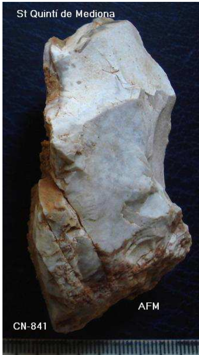
841 Xoopng ¿ Nódul amb extraccions , globular altern .