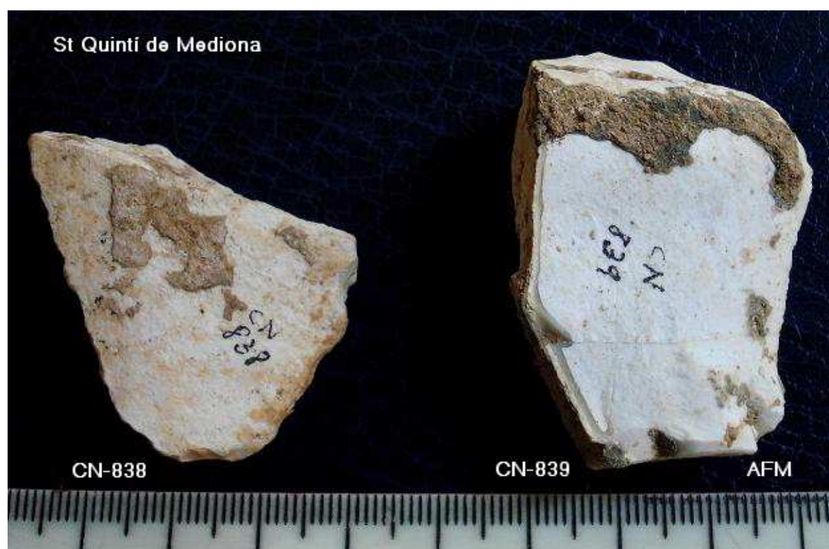
838 Ascla fragmentada de 3 x 3 cm – secció triangular. Rodat. 839 Ascla de 4x 3 cm x 1'2 . taló llis pla i concrecions verdoses.