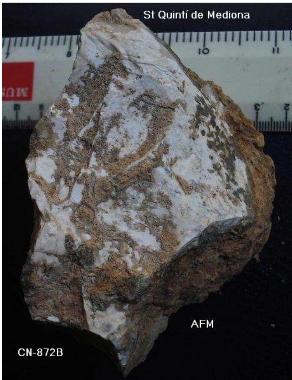
872- XOOPIING damunt de còdol sílex-Retoc Bifacial-8x 9 cm . base reservada, crostes llims verds.