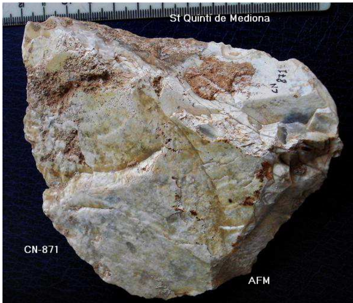
871- TALLANT damunt de ascla de 11 x 11 cm –taló llis pla angle obert, retoc acomodació manual bifacial Ezquerra-Spd i retoc util ¿ distal?.