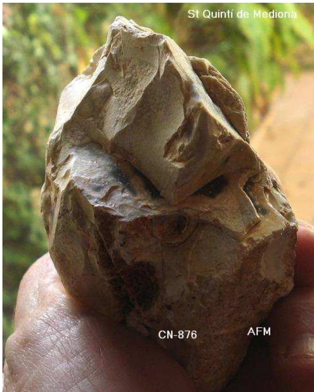
876- XOOPING damunt de nòdul silici i base reservada 10 x 7 x 6 cm , pàtina i concrecions.