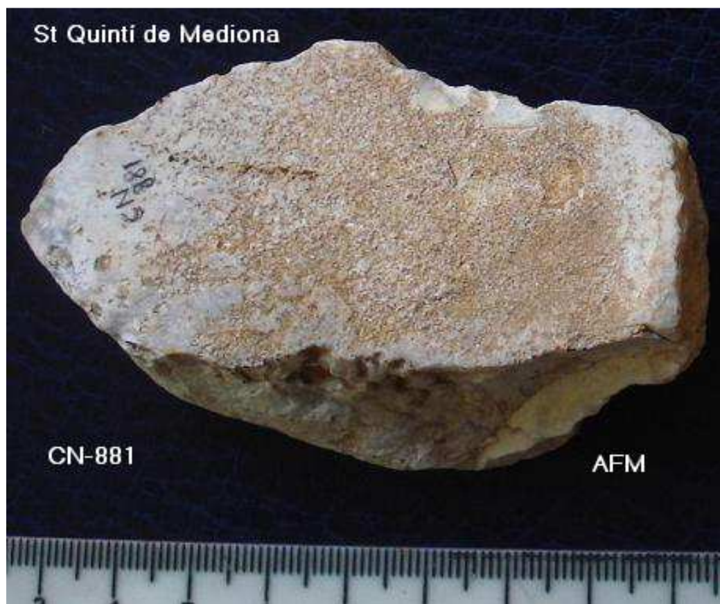
881- BURÍ –Sílex rodats de 8 x 4 cm amb cops burinants distals i patina.