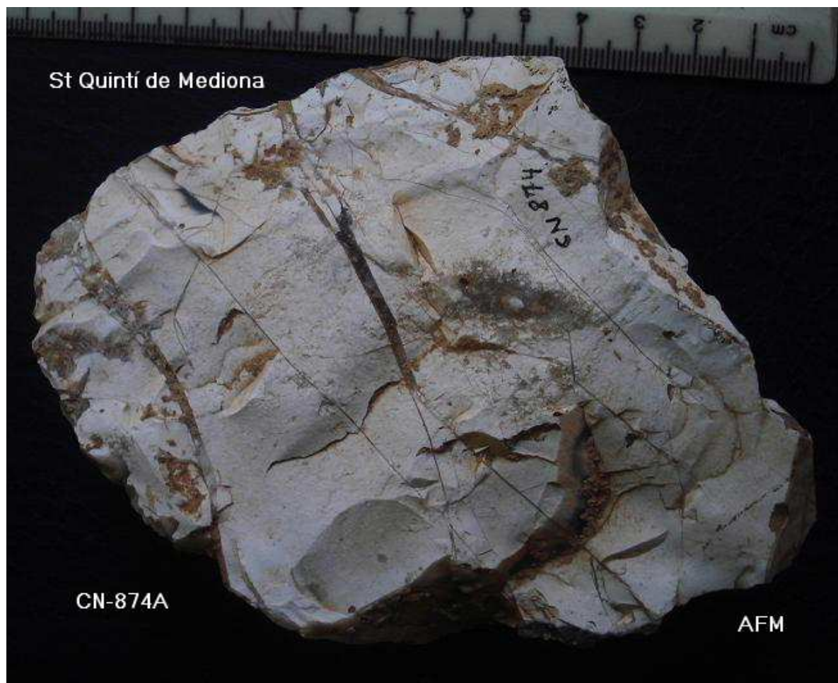
874- Possible prototipos Bifacial , sílex amorf, arestes crostes, 12 x 8 cm x 4 cm gruix. prensió manual . pàtina.