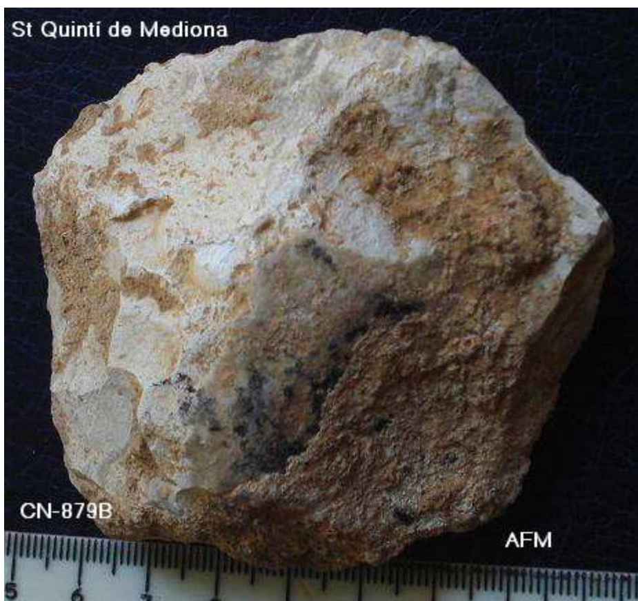
879- R-D Sílex Discoide amb extraccions bifacials irreg. crostes i líquens negres 7x 7 cm 2'5 cm gruix.