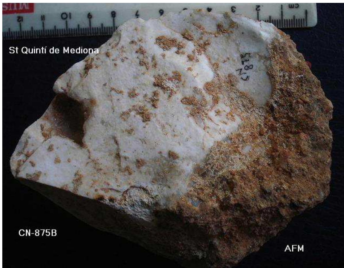
875- BURÍ . Sílex globular , retoc profund distal Burinant . Base reservada. 11x8x6cm , crostes i pàtina.