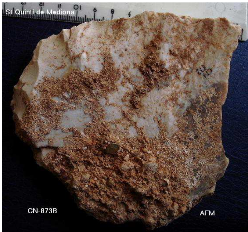
873- TALLANT damunt de ascla de 11x 11 cm –taló retoc prof Triedre distal Burinant (prensíó manual) –concrecions marronosses i graves.