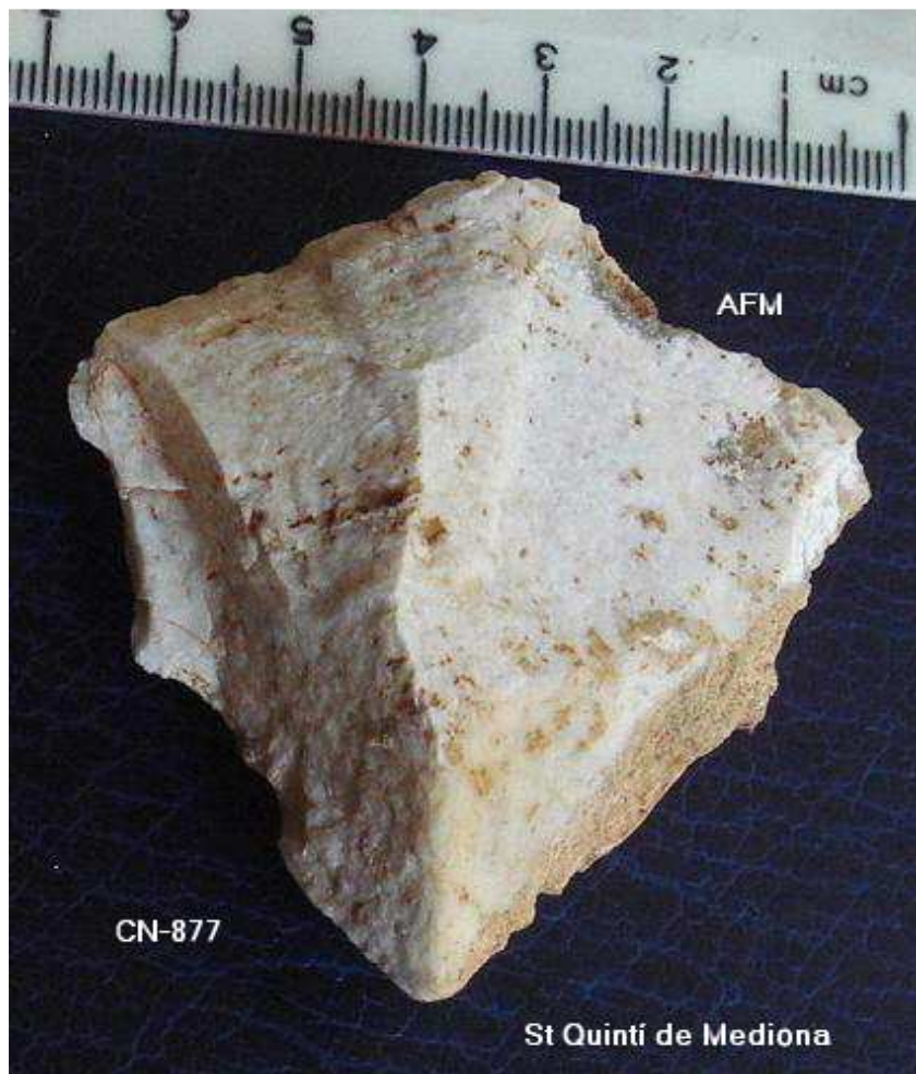
877- P.L. gruixuda , taló diedre 6 x5 cm , pàtina i concrecions.