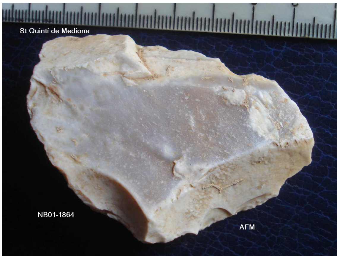
1864 R Rascadora Denticulada , asclá taló diedre(angle obert) , Bulb sup (ret converg irreg)