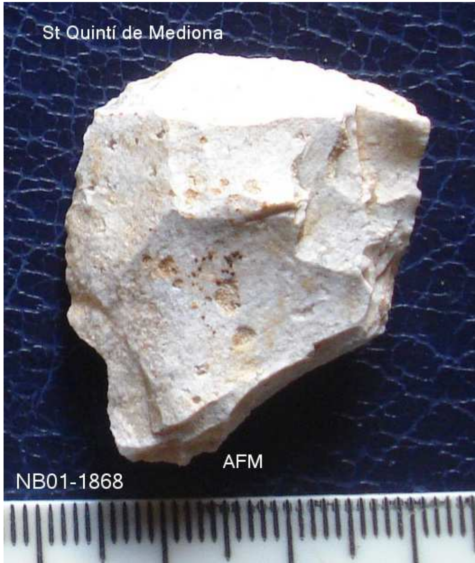
1868 Ascla petita 2'5X3cm (possible retoc ?)