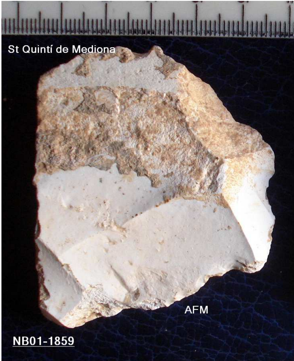
1859 Ascla seccionada de 5X6cm , tipus cuadrangular, retoc liminal irreg i Osca distal