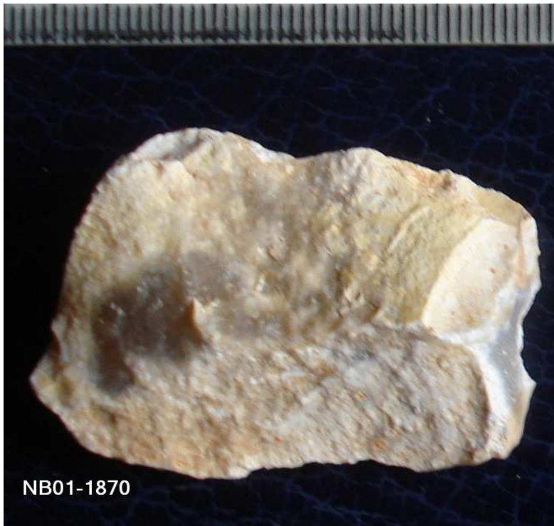
1870 Ascla de 4X3 cm , taló llis pla (angle obert)