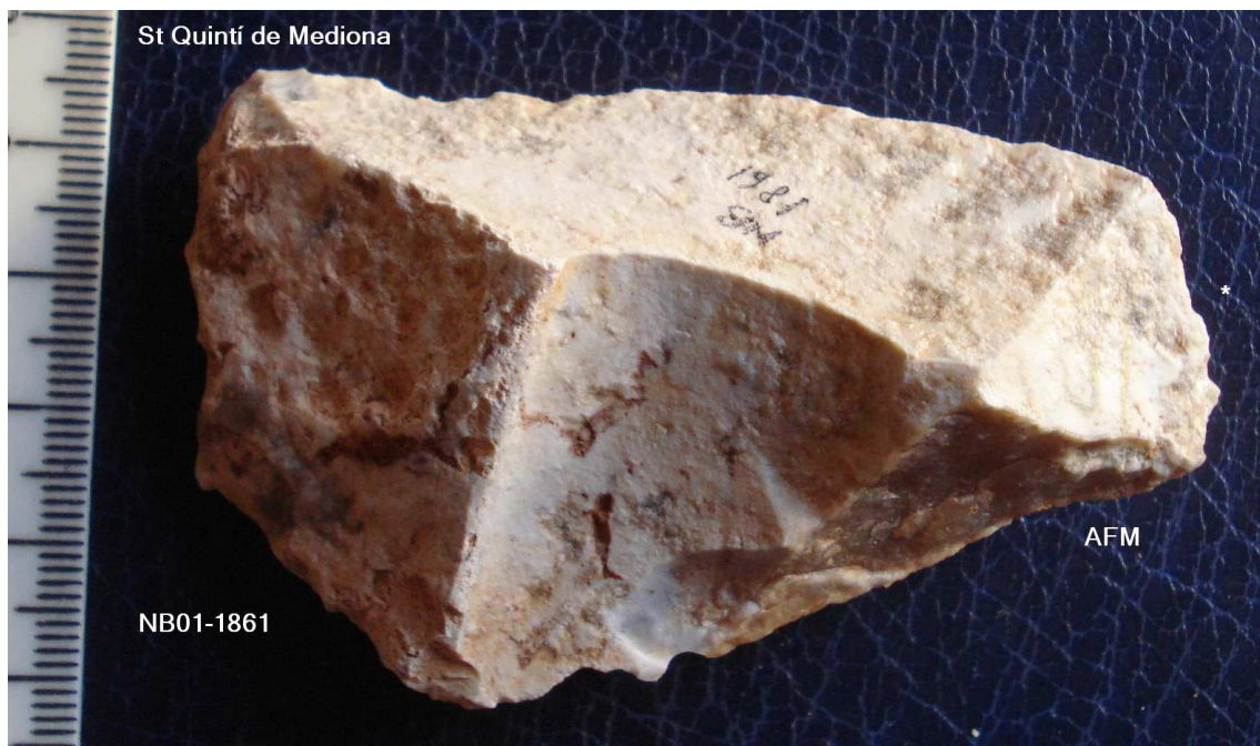
1861 R –Rascadora Lateral invers dreta (scal) ascla laminar de 80 X50 m/m. Ret. Util , concrecions llims marró.