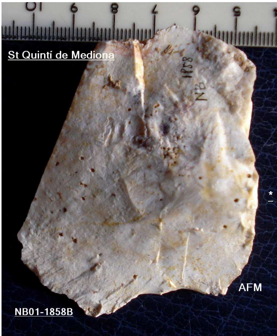
1858 Ascla gruixuda de 6'5 cm X 5'5 , taló diedre- angle 90°