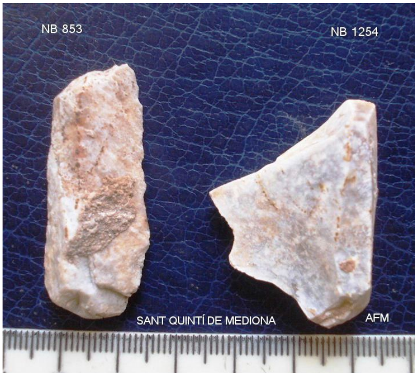
NB 853 Làmina de 43x17x9 mm, sílex gra gros, pàtina i altreracions.