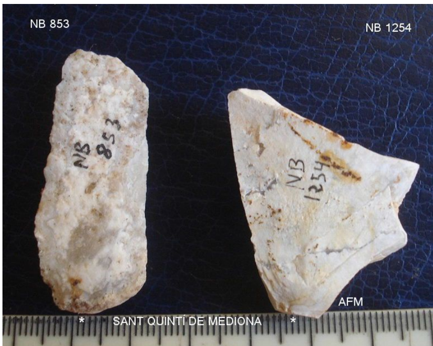
NB 1254 Buri ? damunt de ascla de 39x28x12 mm , pàtina lleugera i taló parcial retc.