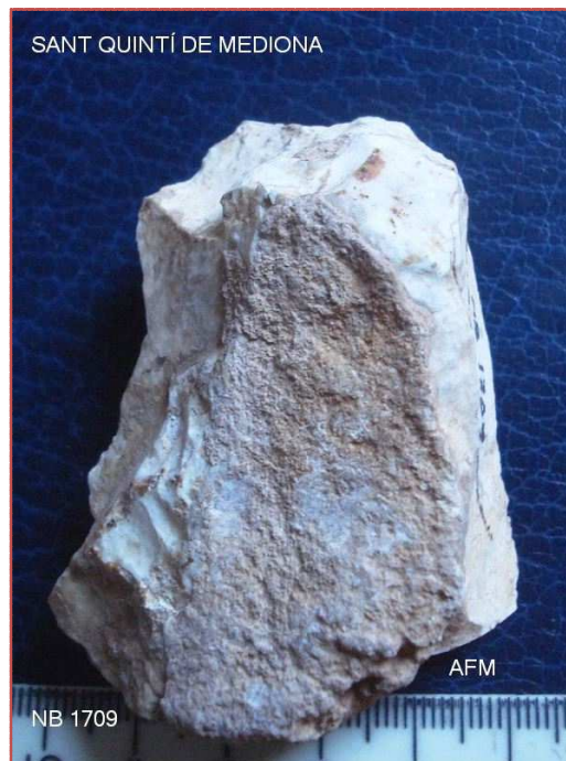
NB 1709 Nucli protolevallois tendència a "tortuga" de Laplace i Bordes. 65x48x25 mm , 3 plans de percussió preparats.