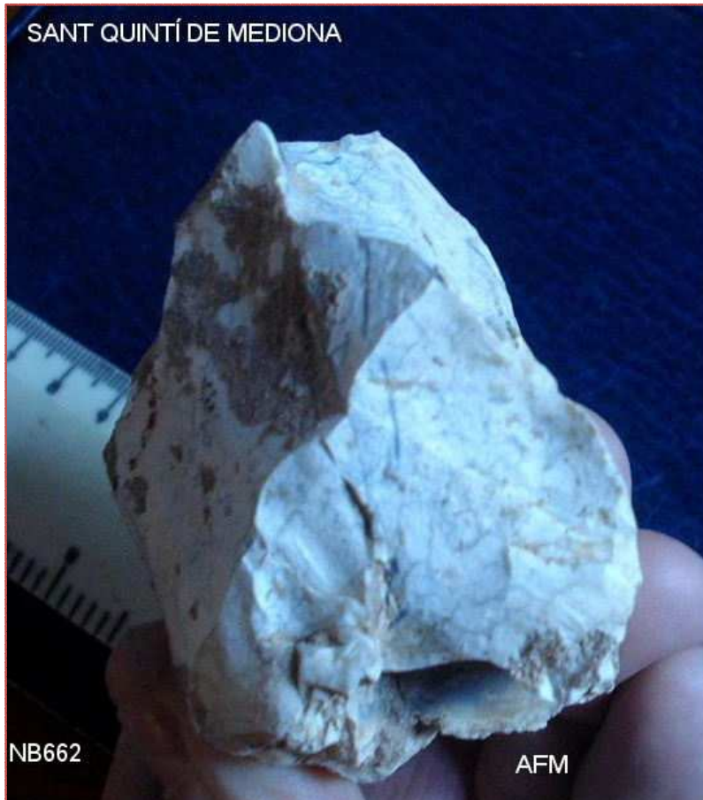
NB 662 Xoopig damunt de Nucli esgotat de 70x 68x49 mm, pàtina blanca i concrecions. Base reservada manual. Altres de similars al assentament.