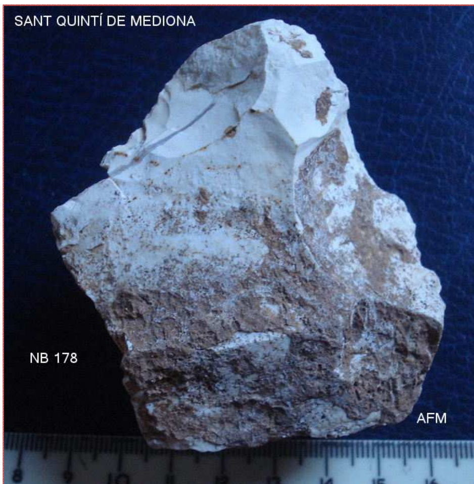
NB 178 NUCLI-XOOPING ? de 70x68x54 mm pàtina i concrecions marrons, 3 plans percutir, protolev ?