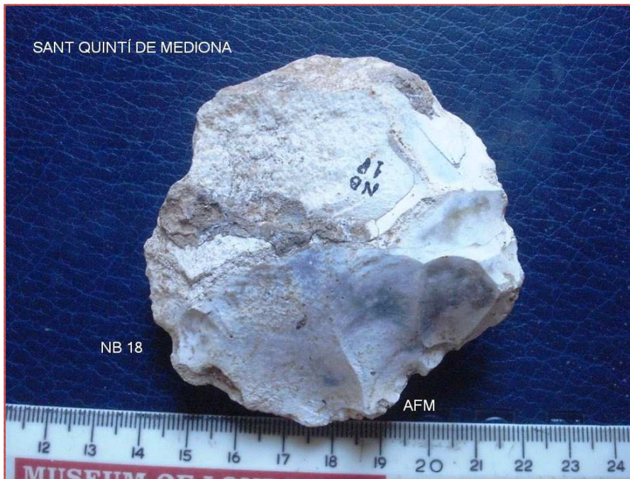
NB 18 DISC damunt de reste de NUCLI LEVALLOIS o ascla KOMBEWA ?) de 76x72x20mm pátina i concreció gris verdosa-F311 Laplace.Element destacat del assentament.