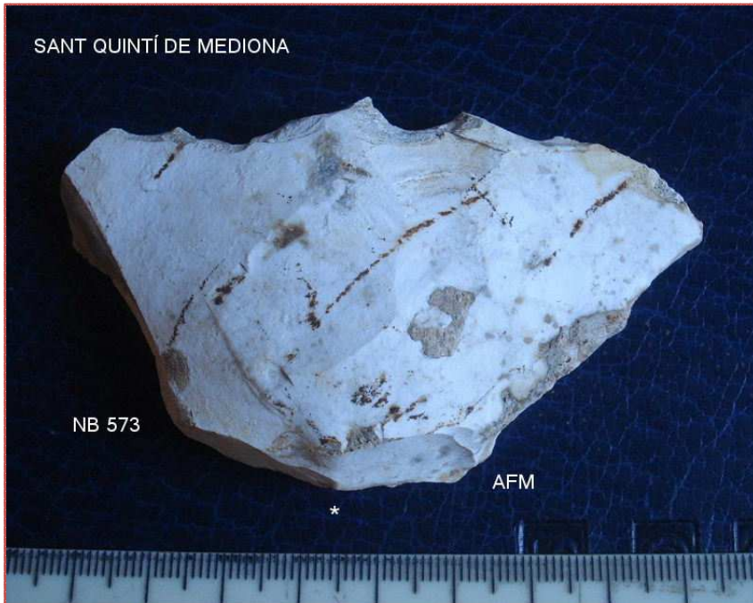
NB 573 Ascla Levallois (Proto?) de 50x88x16 mm-apaissada-taló facetat, pàtina blanca i retrencaments.