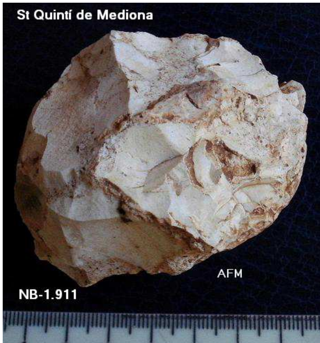
1.911 XOOPING Tol -(N) 6'5x 5x3'5 cm -pàtina marró.