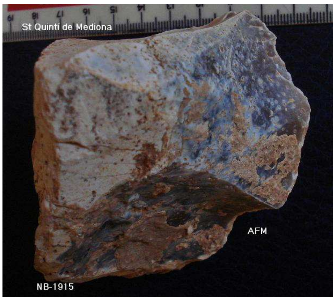
1.915 N Piramidal –Rabot- 7x8x7 cm, pàtina marronosa parcial.