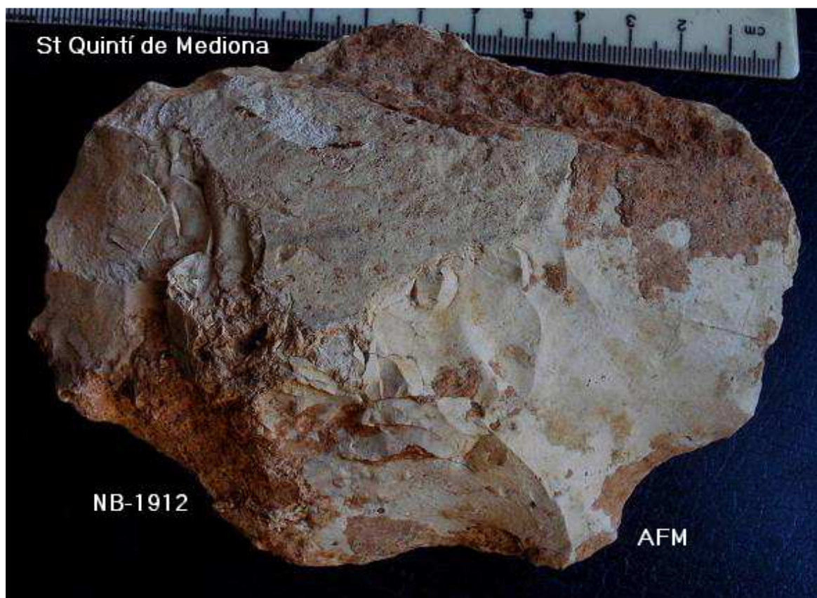
1.912 TALLANT damunt de ascla -12 x 9 cm – taló preparat i facetat. Pàtina i concrecions argiloses.