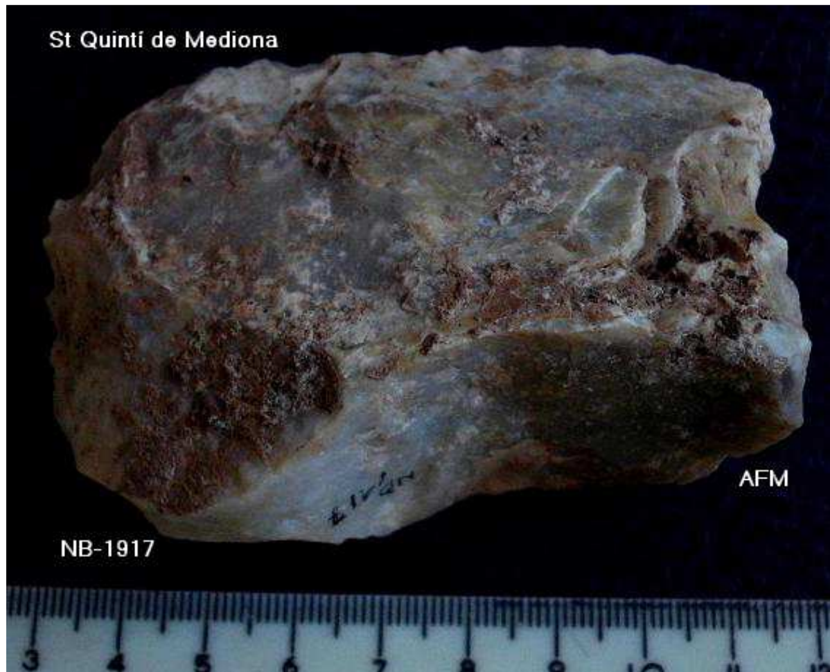
1.917 R23 .damunt de ascla Kombewa ( S marg esquerra prox dist ) 8'5x 6x 3'5 cm