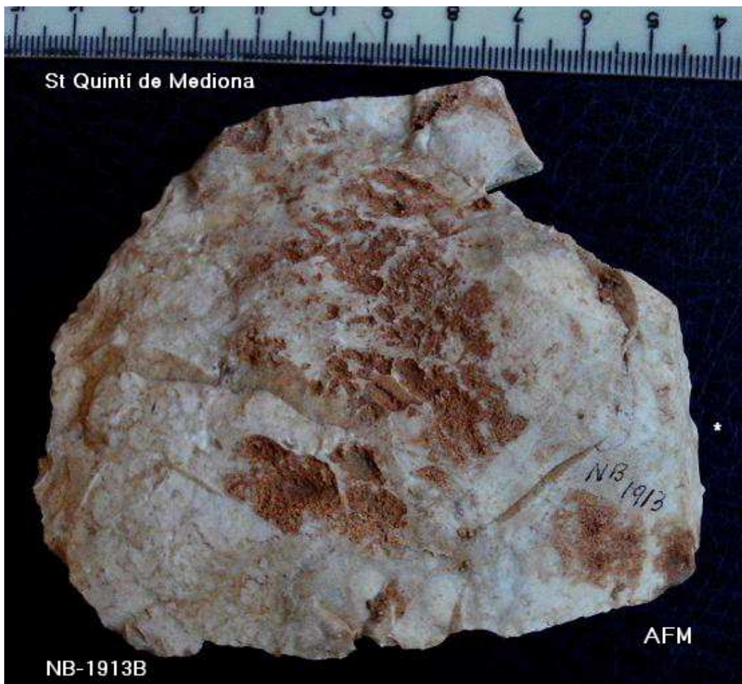
1.913 Asclà de 9x8 cm , taló llis còncav obert R 21 (D) altern distal.