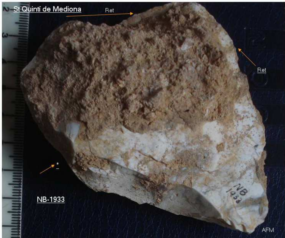
1933- R323 Ascla rodada de 7x 9 x 3 cm (lat-trav) ? Spd(A) + Spd(A) Esquerra