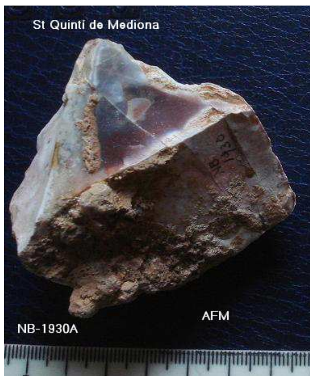
1930- N Nucli Polièdric 5'5x 5x 4'5 cm . pàtina i concrecions.