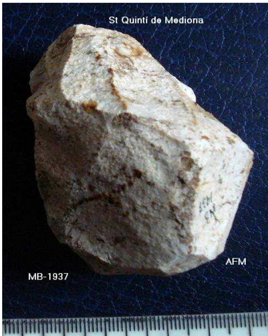
1937- Nucli Polièdric 6x4'5x4 cm , multiples facetes. Parcialment rodat.