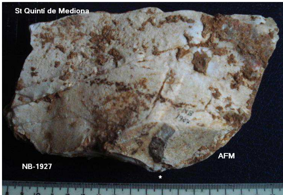
1927- Ascla de 9x 19x5 cm –taló angle obert- concrecions cara A. (Ascla gran )