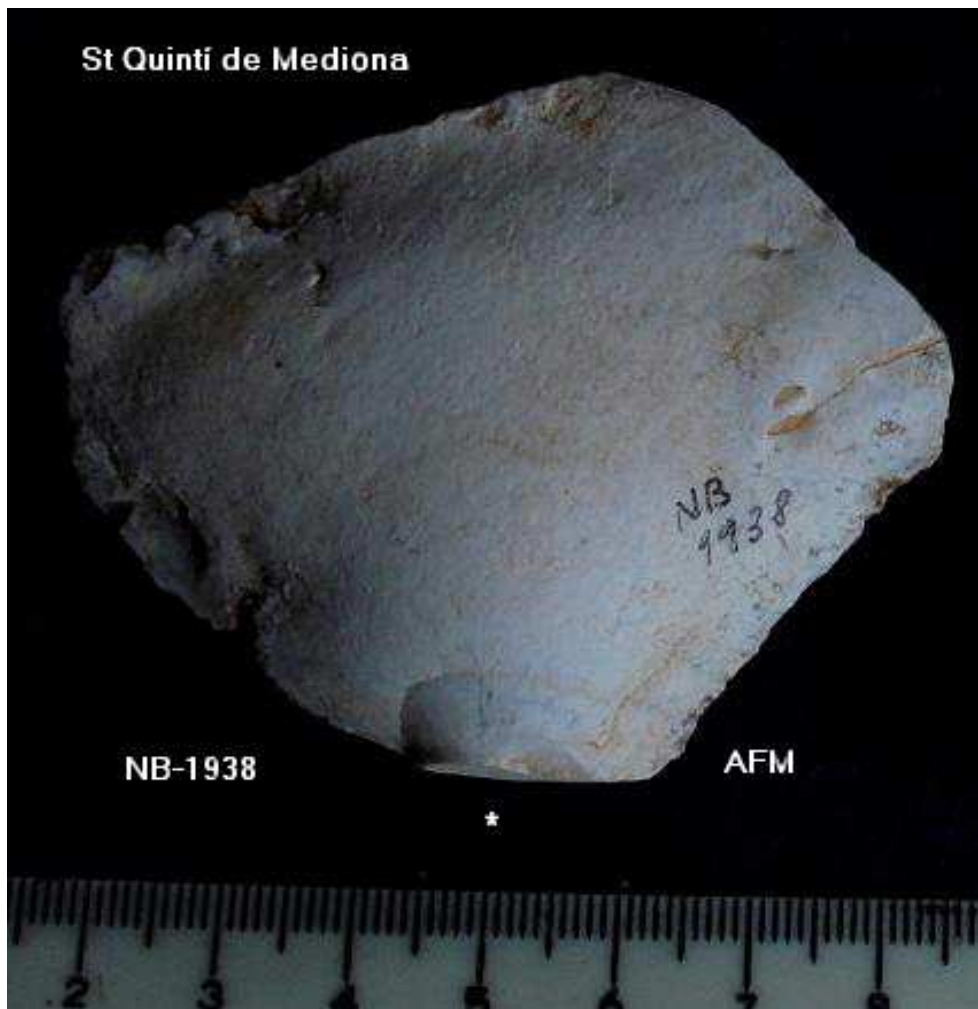
1938- Ascla Bulb bbb de 7x5 cm –taló diedre, pàtina i concrecions.