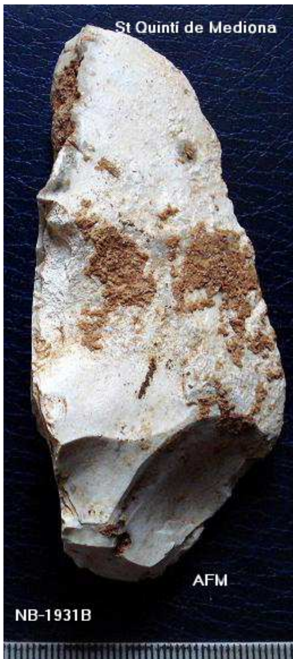
1931- B- Unifacial parcial de 9 x 4'5 cm pàtina blanca i concrecions.