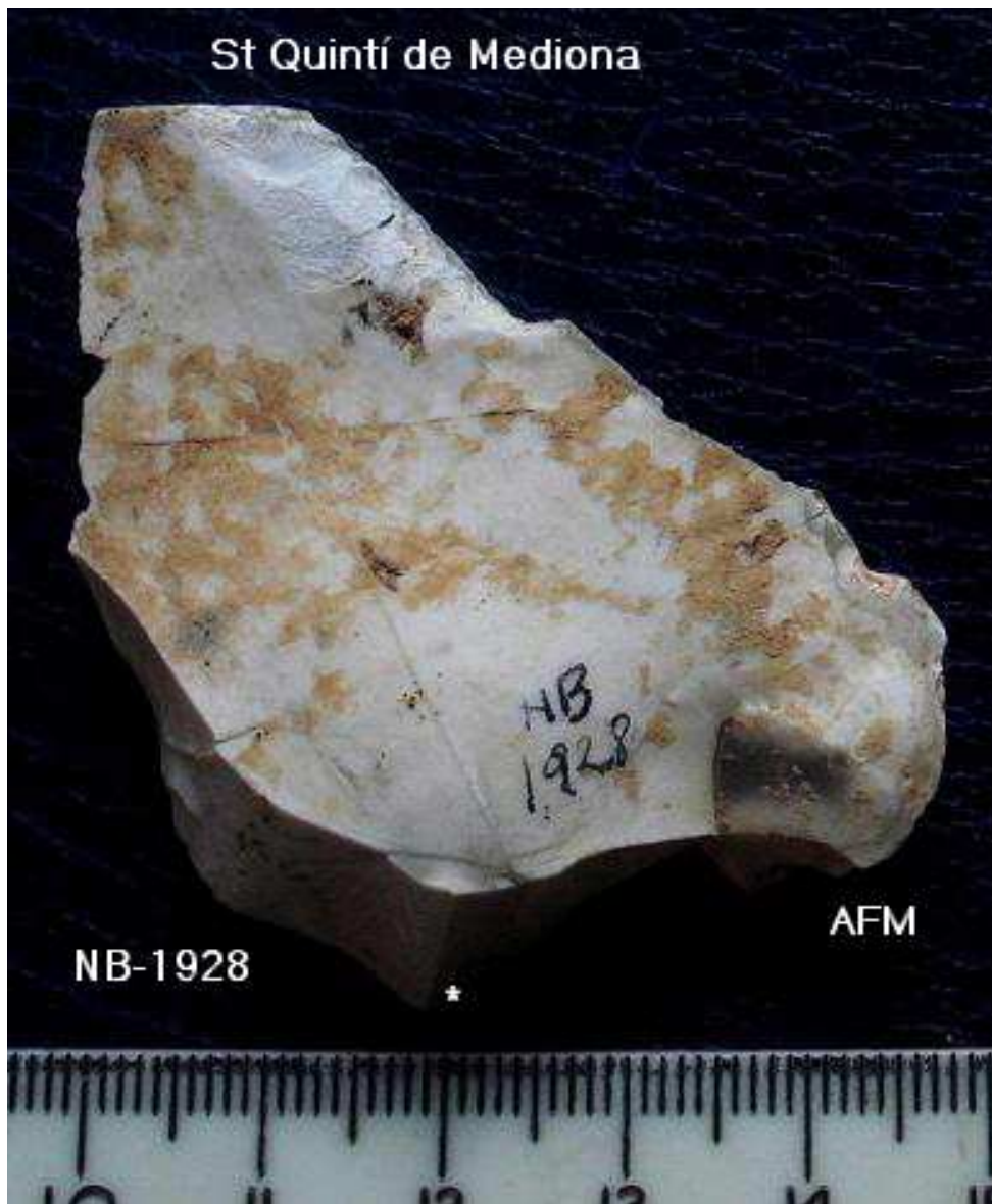
1928- R23 –Rascadora Trav parcial de 3'5x 6 cm .Sp invers distal) taló facetat, pàtina blanc.