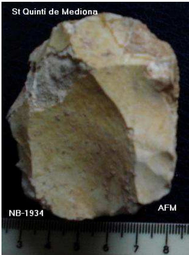
1934- Nucli Levallois Disc 6'5x 6x4 cm , concrecions i pàtina blanca