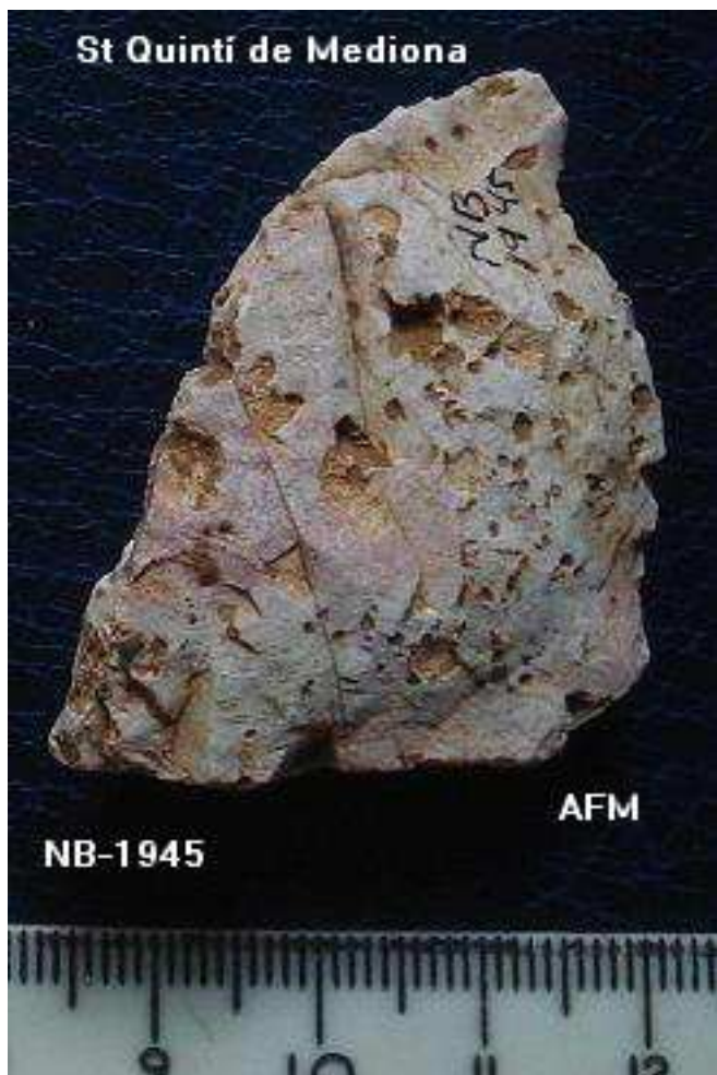
1945-Punta de sílex- alterada de 4'5x3'5 cm.