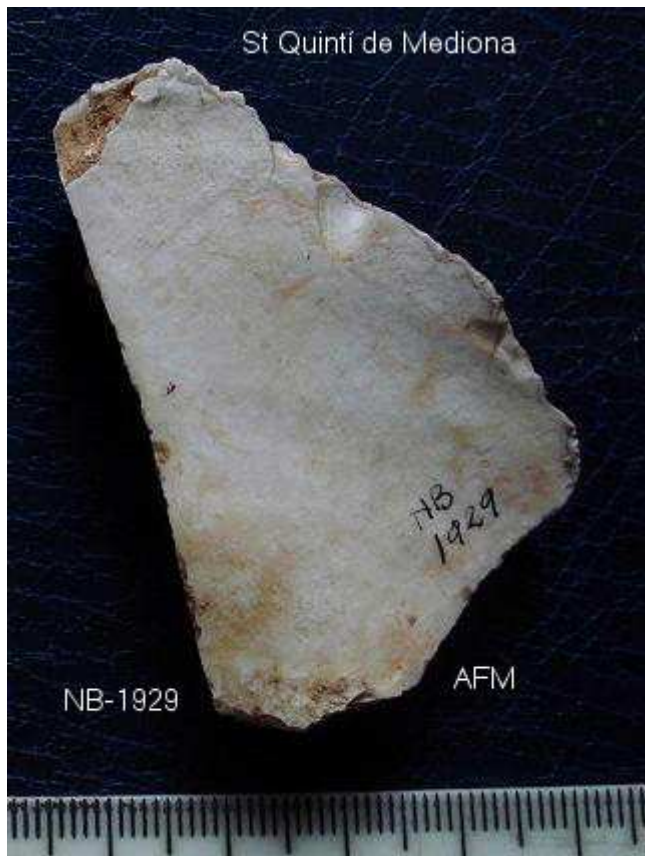
1929 Ascla de 6x3'5 cm . taló fragmentat. Concrecions verdes