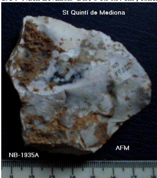
1935- Nucli Levallois esgotat de 6x7x2 cm .Tendència bifacial –pàtina blanc.