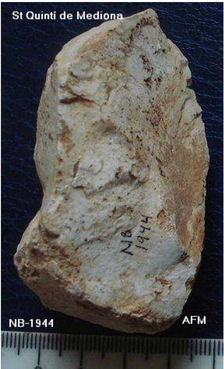
1944-PIC –damunt de sílex globular de 7x4x3cm –pàtina marro.