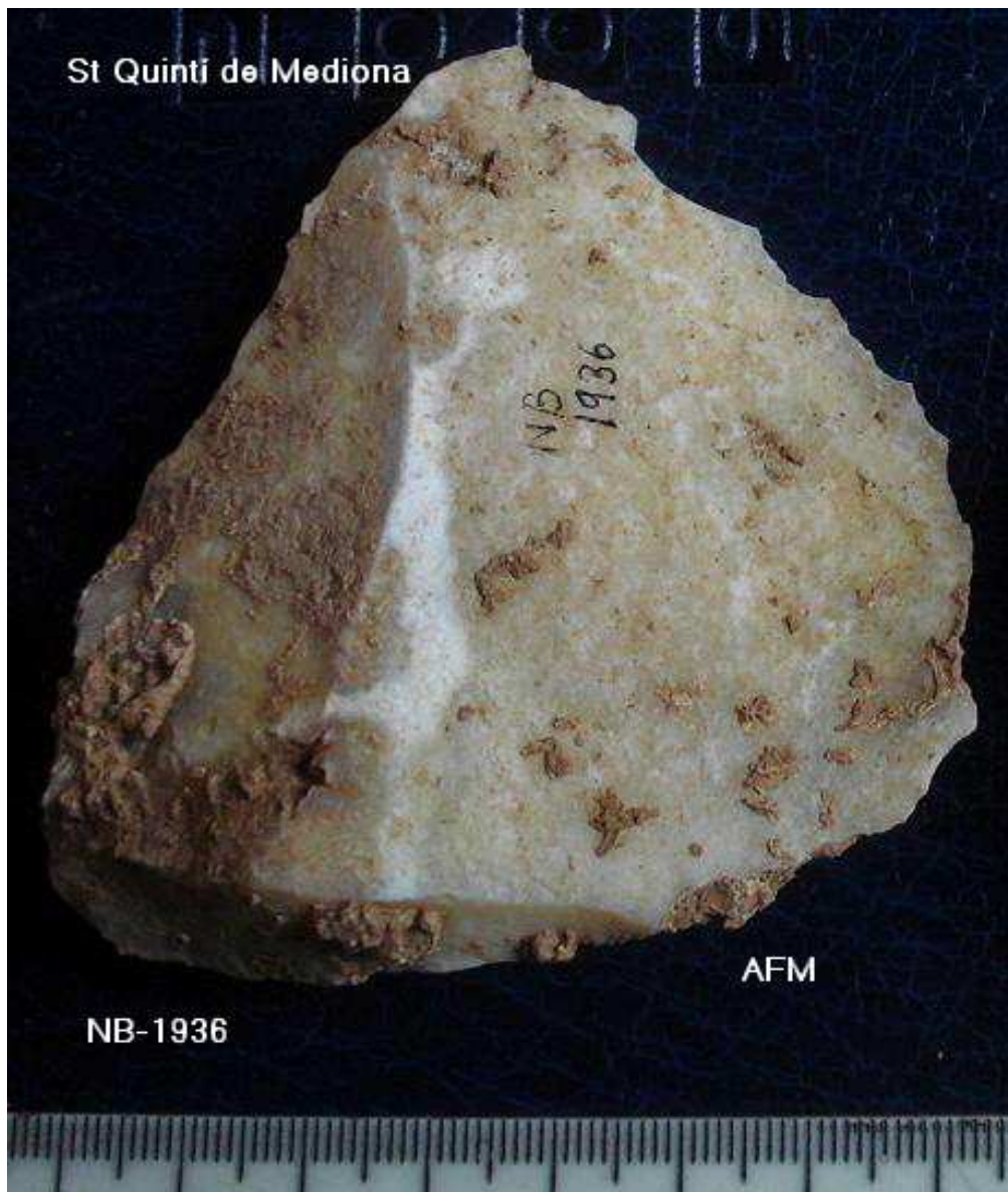
1936- Ascla triangular taló suprimit ?Kombewa de 7x7x2 cm , pàtina blanc.