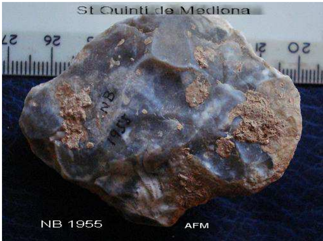
1955 Bifacial petit- Nodular de 6x 4'5 cm – concrecions i llims.