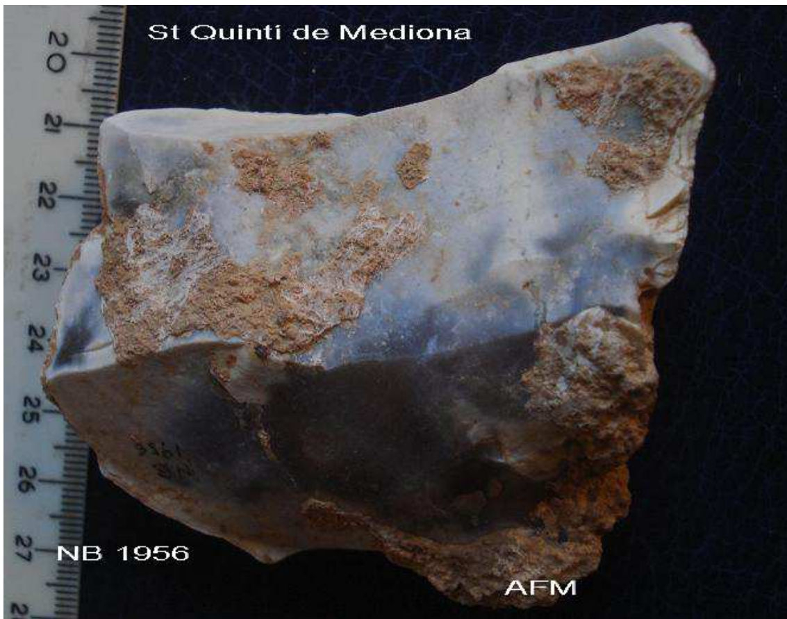
1956 Nucli pla unifacial 7'5 x 6 x 2'5 cm pàtima blanca.