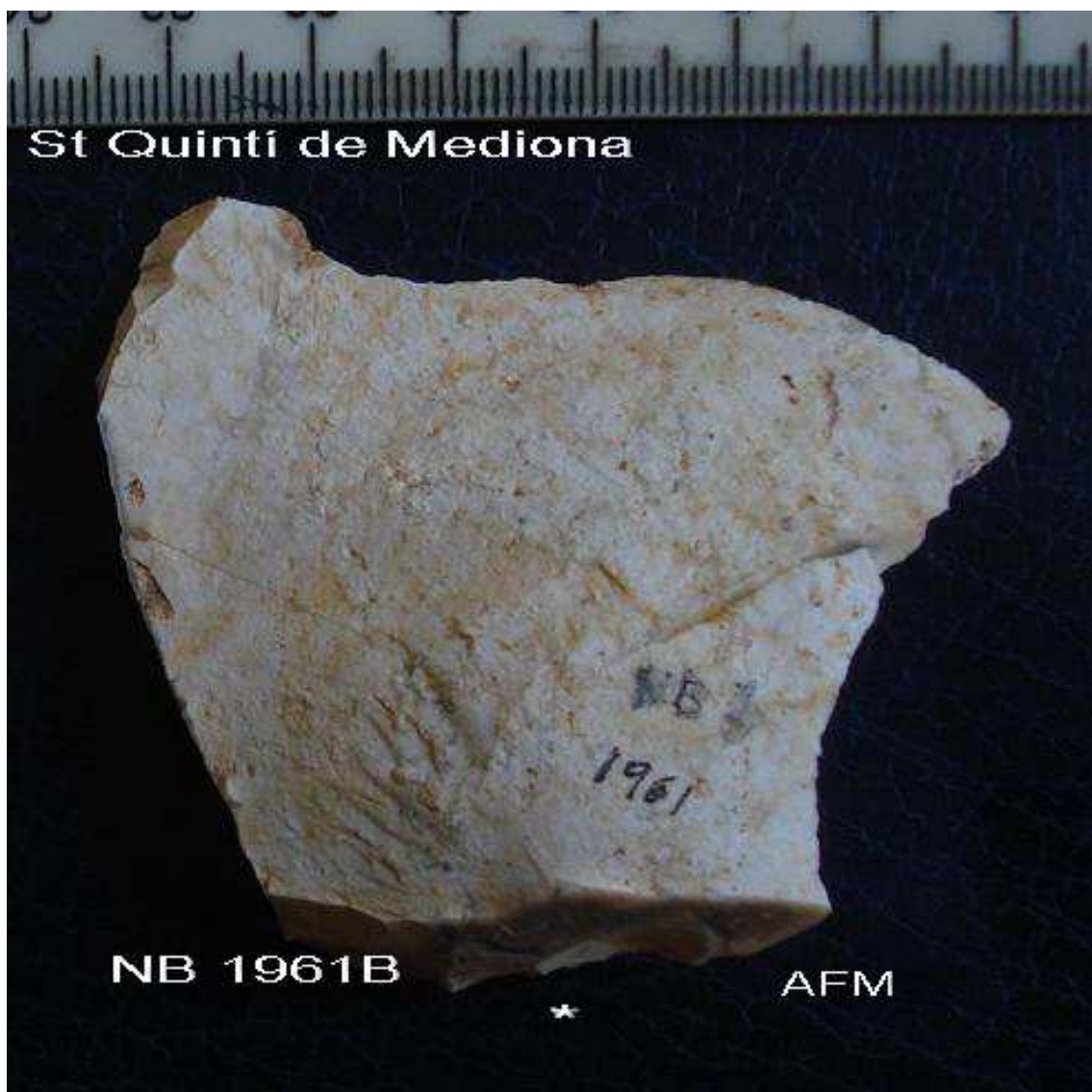
1961 Ascla Levallois de 5'5 x 6 cm , taló facetat, bulb bb , planta irreg.