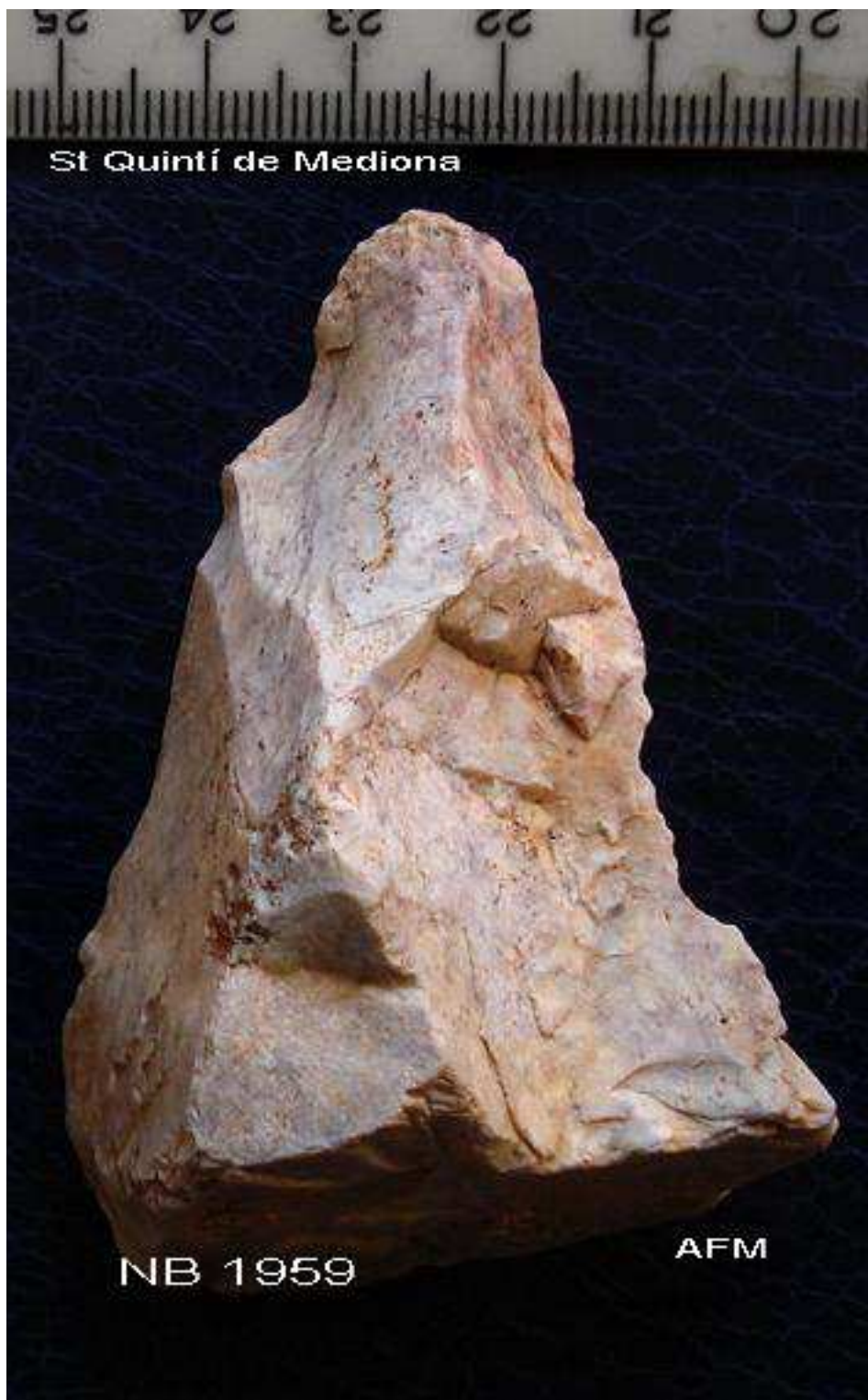
1959 D324 –Punta Dent gruixuda 7x4x3 cm , nòdul . PUNTA DE TAIAC ?