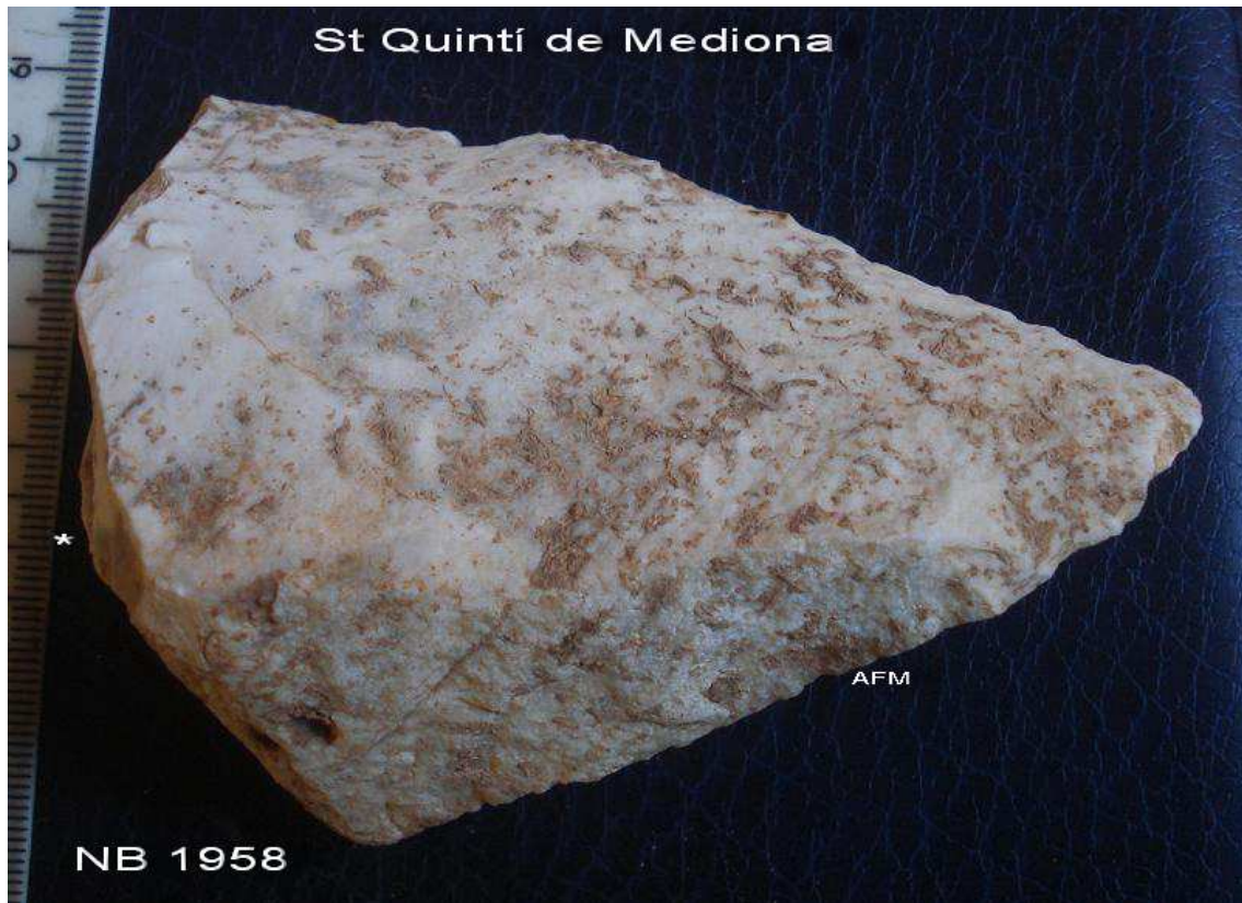
1958 PUNTA de 10 x 7 x 3'5 cm de sílex blanc porós (Sp di med dist + Sp (D) esquerra) .planta triangular , bulb bb . pla de percussió seccionat.