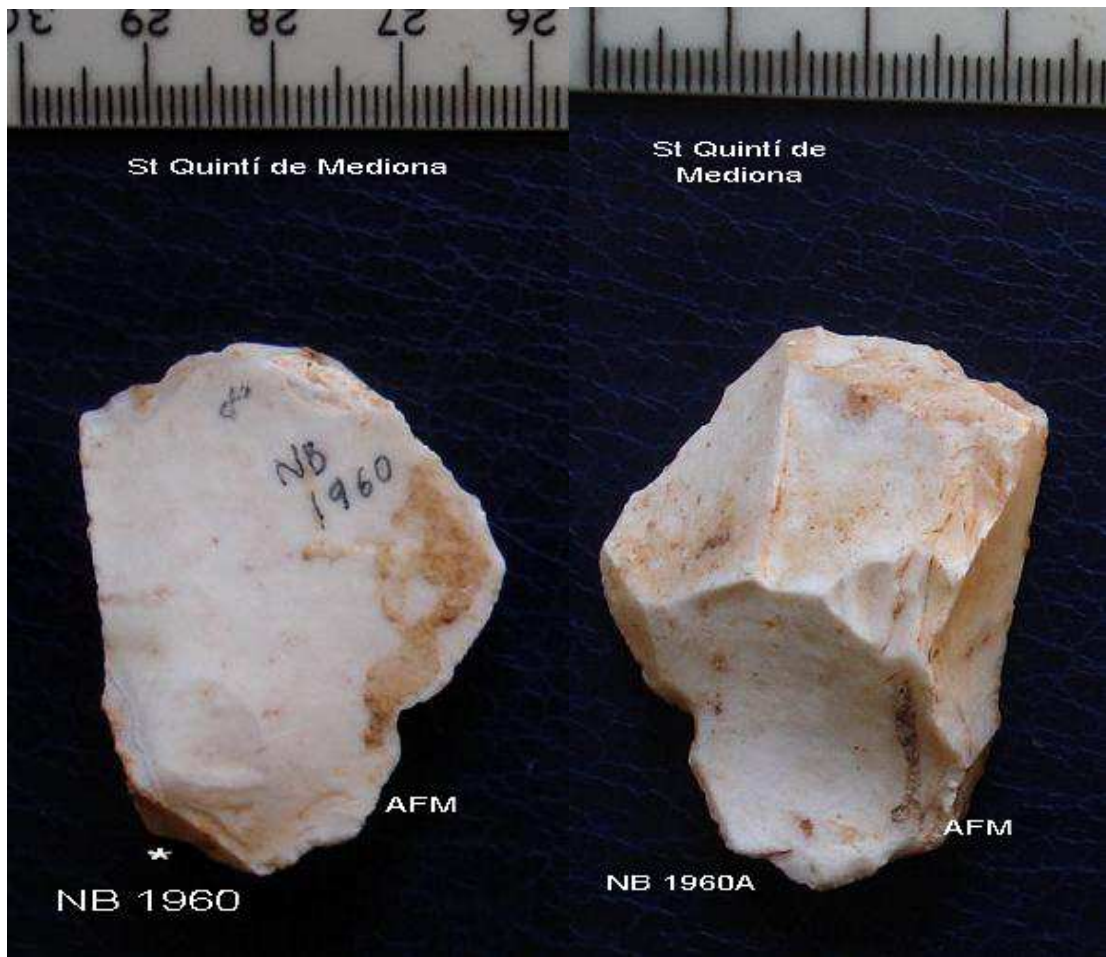
1960 Ascla de 3'5x 3 cm , extraccions radials , meplat lateral pàtina blanc marro