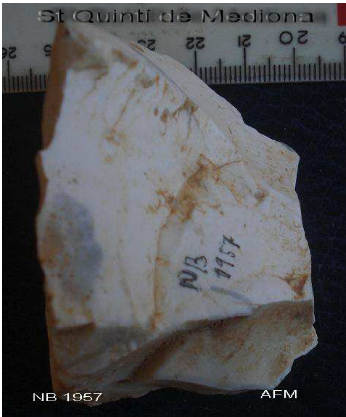
1957 Nucli PIRAMIDAL 6x 5 x 5'5cm , sílex blanc mat.