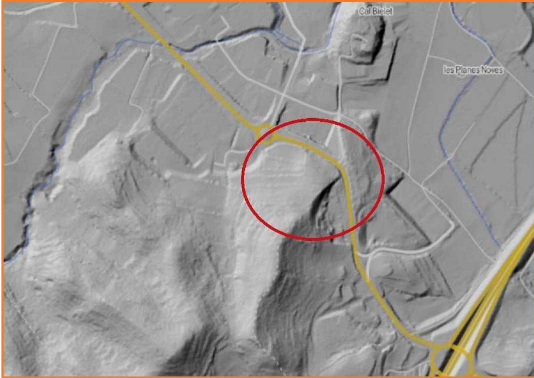
Vessants del Puig de les Forques. sector Bielel.

Antoni Freixas Massana. Setembre del 2.023.