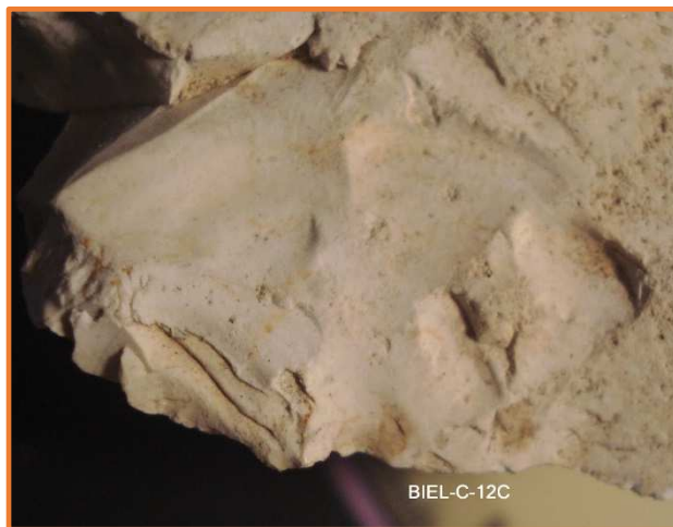
Estigmes de retoc.