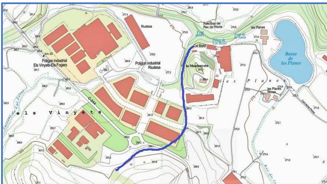
Recorregut del antic torrent de Cal Bielet fins els anys 80 del segle XX.

Consideracions : A tot l'entorn del peu de muntanya de Forques i Estosses hi podem veure una gran quantitat de nòduls de sílex i restes de talla amb matèria primera de bona qualitat. A ben segur que la zona amaga algun jaciment o assentament que presenti un conjunt homogeni, però el que he vist fins al moment son troballes esparses de útils del Paleolític amb una indefinició cronològica de materials que podrien correspondre a un Plistocè Mitjà i procedents dels ventalls al·luvials antics i desmantellats .Altra cosa son les restes de sílex fresc i talla recent de finals del Neolític.