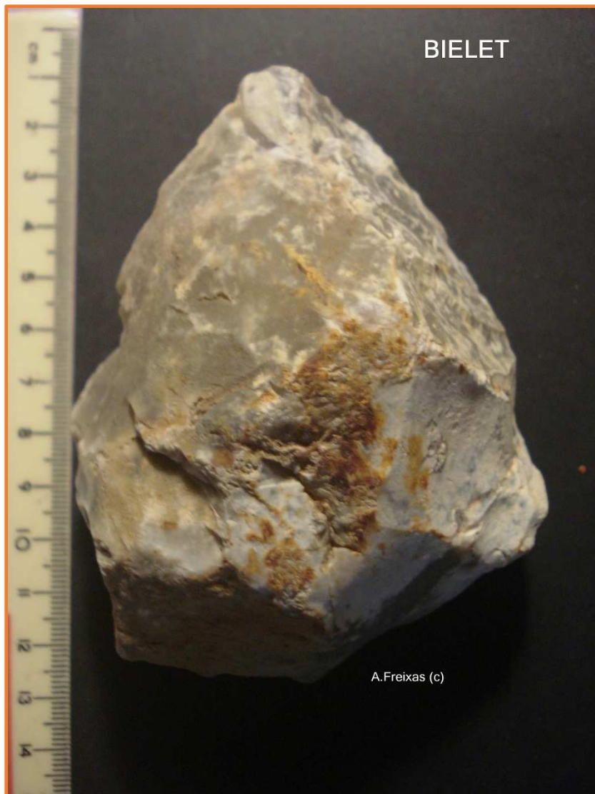
Cara B amb la base reservada i rastres de rella.