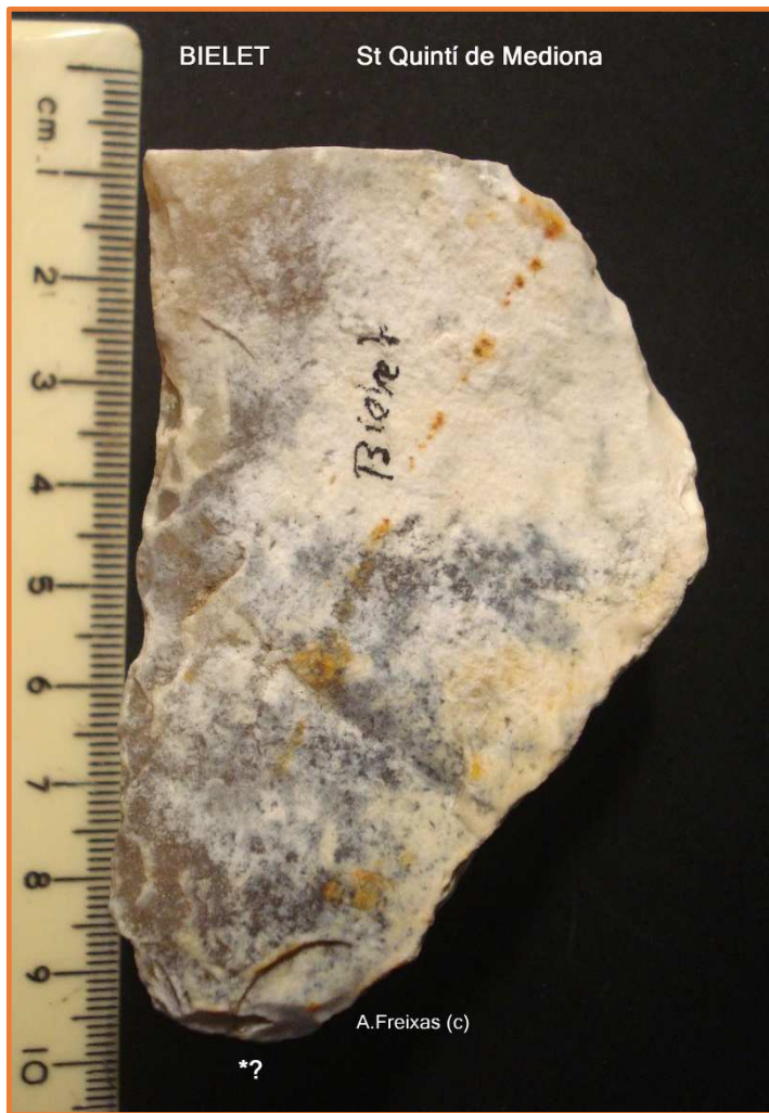
Rascadora sobre placa ?