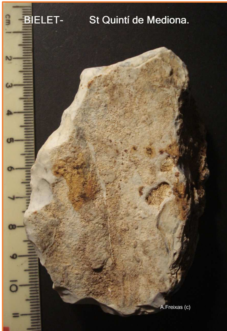
Rascadora sobre placa .