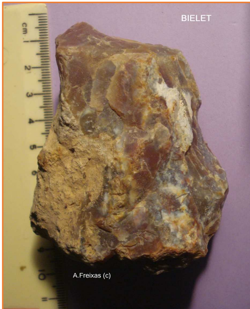
Nòdul amb extraccions.