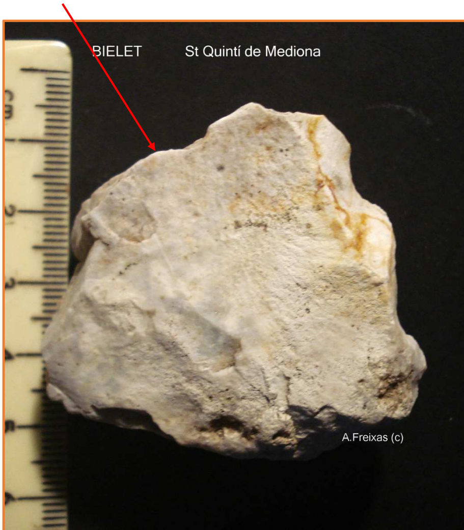
Nucli pla de tipus Levallois, rodat i alterat.