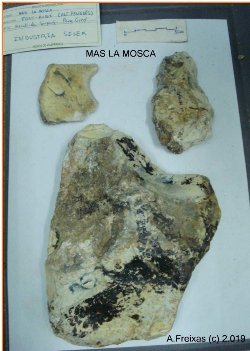
Del Mas de la Mosca de Guardiola de Font Rubí.

Al voltant del barri de la Rubiola, Pereres i Mas Pinyol, amb el torrent de Bolet i les "terrasses de la Massana" tenim materials amb algunes fitxes dels anys 60, i dels anys 70. Fruit de prospeccions superficials. Tot i la possible barreja, destaquen algunes peces grans, molt erosionades, amb forta pàtina i taques de líquens negres com la de la Mosca.