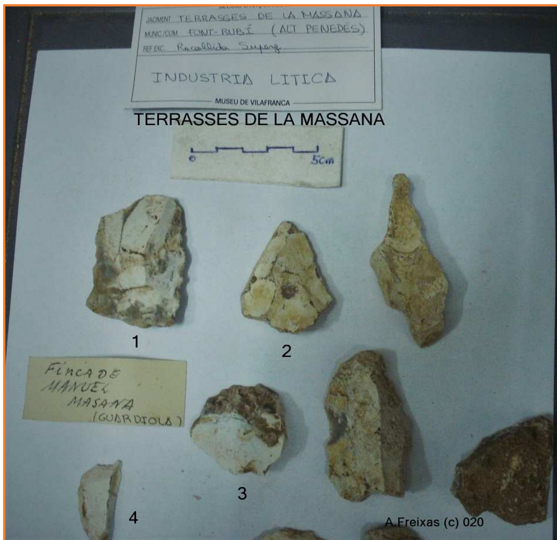
Una mostra dels materials més petits, amb el nº2 de característiques Levallois i patina marró clar. Prospecció superficial de Pere Giró "terrasses de la Massana", anys 60 del segle XX.